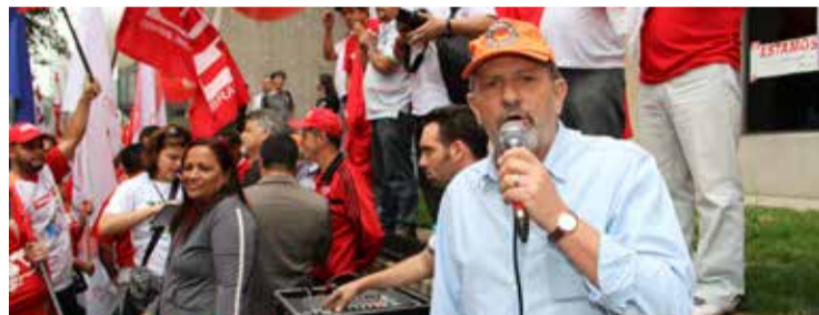
Presidiu a Federação dos Metalúrgicos do Estado de SP