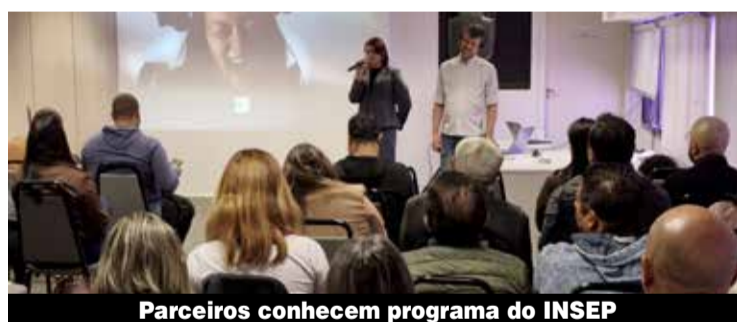
Parceiros conhecem programa do INSEP

Unicamp - O próximo encontro será realizado nesta sexta-feira, 19, no Cesit/Unicamp. Acesse mais informações e fotos das visitas no www.sindmetal.org.br .