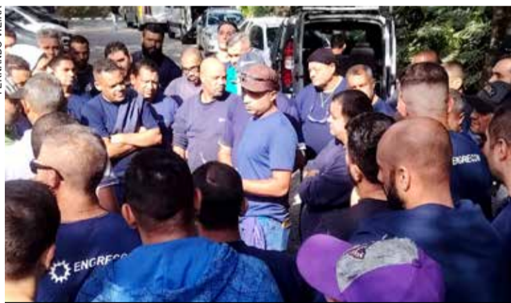
Trabalhadores também conquistaram avanços