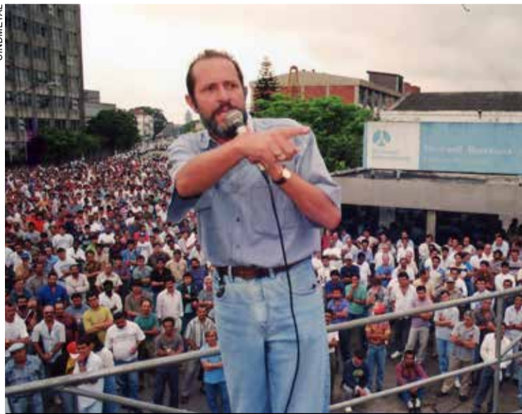
Vice-presidente esteve à frente de lutas importantes