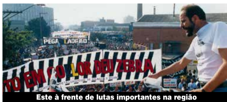
Este à frente de lutas importantes na região