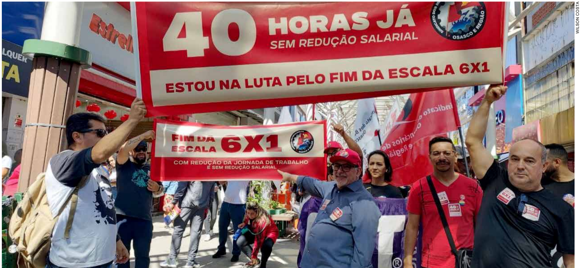
Além de fortalecer a mobilização nas fábricas pela redução da jornada, Sindicato tem participado de atos

Levantamento mostra que metalúrgicos que trabalham mais de 40 horas recebem menos p.2 e 3