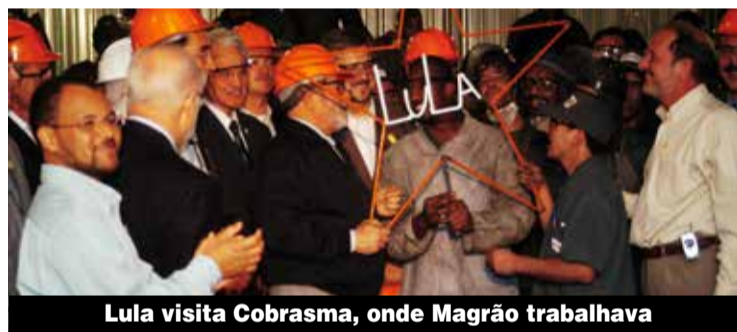
Lula visita Cobrasma, onde Magrão trabalhava