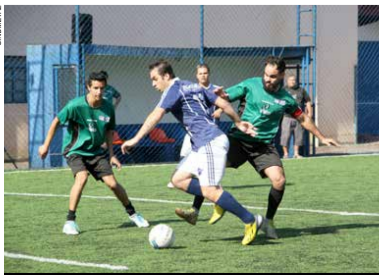
Bola vai rolar a partir das 19h no clube