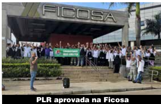
PLR aprovada na Ficosa