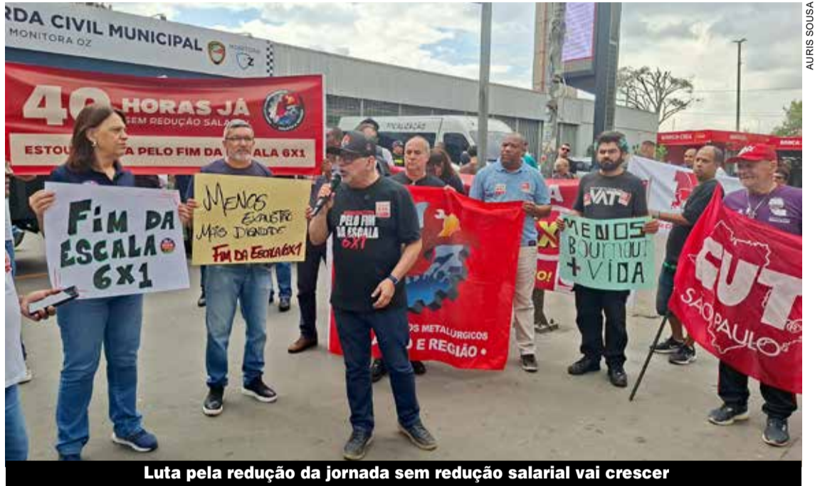
Luta pela redução da jornada sem redução salarial vai crescer