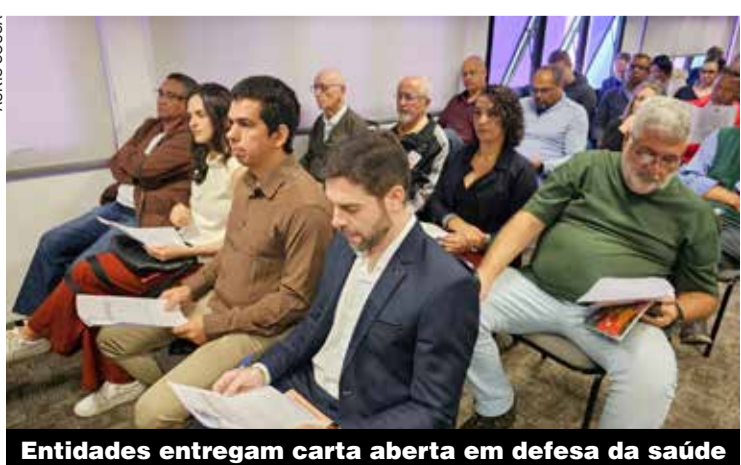
Entidades entregam carta aberta em defesa da saúde