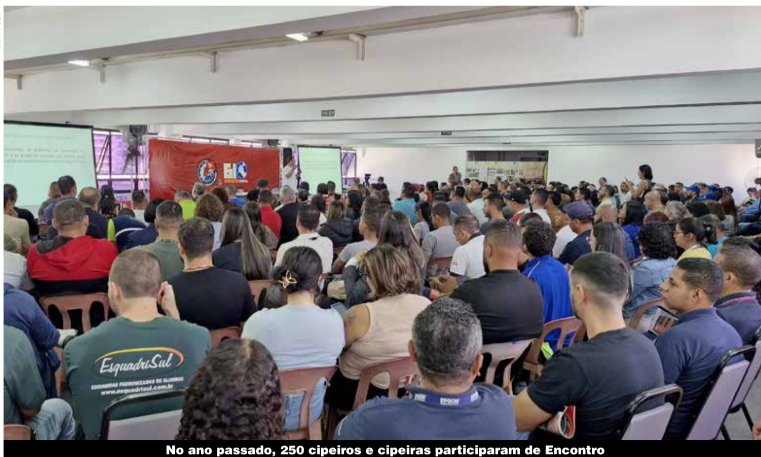
No ano passado, 250 cipeiros e cipeiras participaram de Encontro