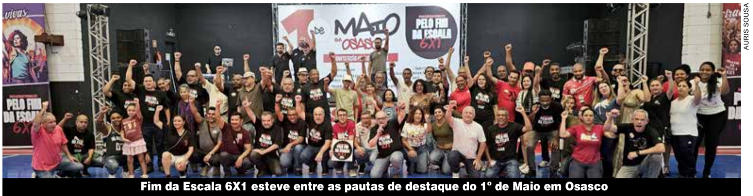
Fim da Escala 6X1 esteve entre as pautas de destaque do 1º de Maio em Osasco

“Essa movimentação representa um passo importante na luta por condições de trabalho mais dignas e por uma melhor qualidade de vida para a classe