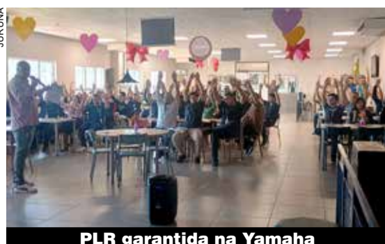
PLR garantida na Yamaha