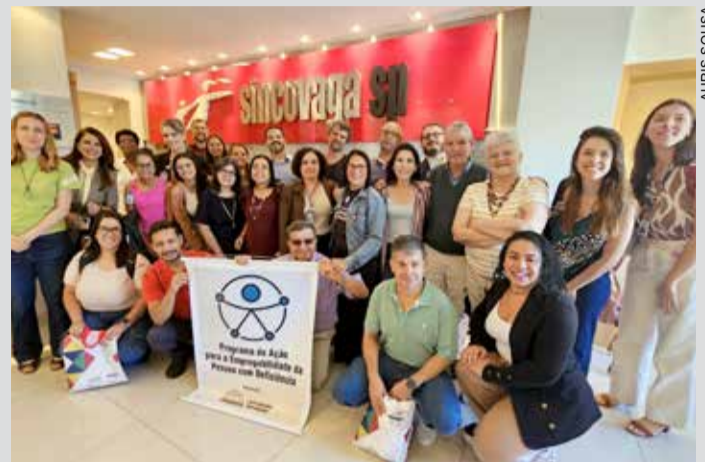
Em 06/05 visita foi no Sincovaga/Coexistir

Nesta quinta-feira, 14, o Programa de Ação para a Empregabilidade da Pessoa com Deficiência chega ao Senai de Itu, pioneiro em educação inclusiva. Os participantes vão conhecer iniciativas voltadas à formação profissional inclusiva, especialmente de jovens com deficiência.