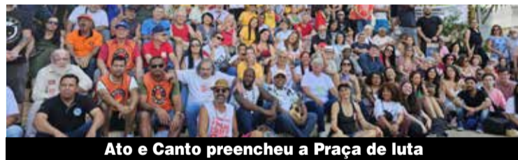
Ato e Canto preencheu a Praça de luta

Força Sindical - No próprio dia 28 de abril, o Sindicato participou de ato na Força Sindical que também reforçou a luta em defesa da saúde e segurança no trabalho. Além disso, debateu medidas de prevenção, combate ao adoecimento, fortalecimento da fiscalização, redução da jornada e a luta por melhores condições de trabalho.