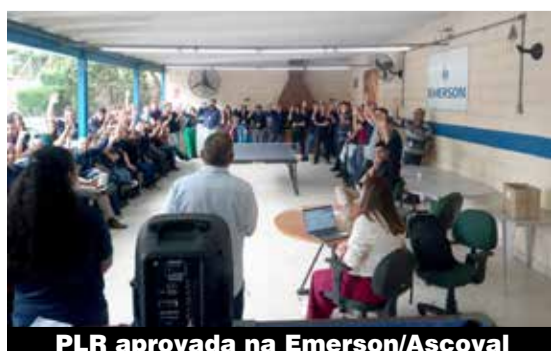
PLR aprovada na Emerson/Ascoval