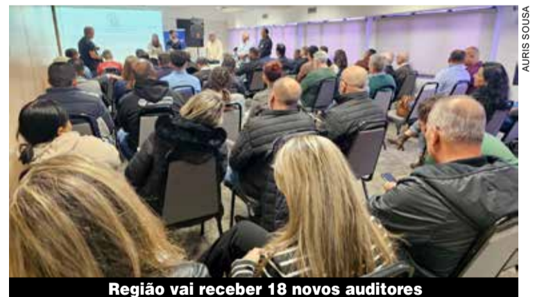
Região vai receber 18 novos auditores

Dirigentes sindicais, organizados pelo Cissor, reuniram-se na terça-feira, 12, com os novos auditores fiscais do trabalho, que vão atuar nas 15 cidades abrangidas pela Gerência Regional do Trabalho e Emprego em Osasco. A reunião aconteceu na sede do Sindicato.