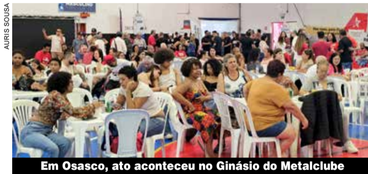
Em Osasco, ato aconteceu no Ginásio do Metalclube