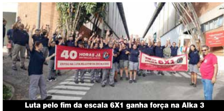
Luta pelo fim da escala 6X1 ganha força na Alka 3

a vida da classe trabalhadora (mais tempo para família, saúde, qualificação, lazer), além