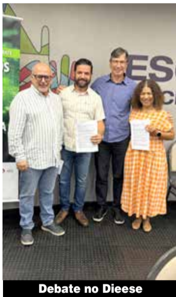
Debate no Dieese

O debate integra um movimento em defesa das pesquisas científicas, das estatísticas nacionais e das instituições públicas responsáveis pela produção de dados e conhecimento no Brasil.