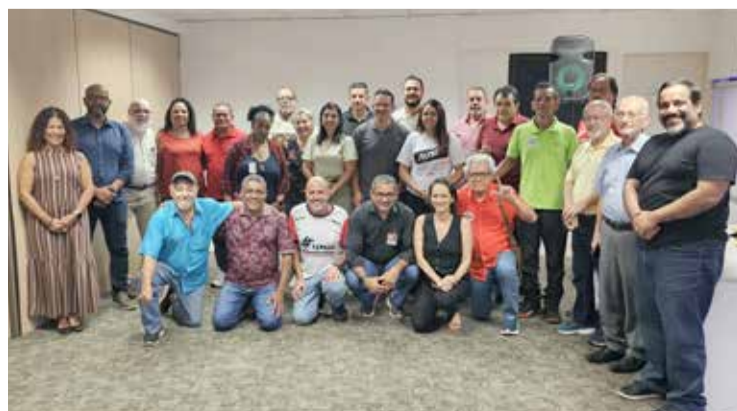
Reunião de articulação aconteceu na sede

– A ação atende também estratégia de luta construída pelas centrais sindicais que, neste ano, decidiram descentralizar a mobilização para que ela chegue a mais trabalhadores e trabalhadoras. A proposta busca fortalecer o diálogo com a classe trabalhadora, dar visibilidade às reivindicações e impulsionar a organização sindical por meio de ações em todo país.