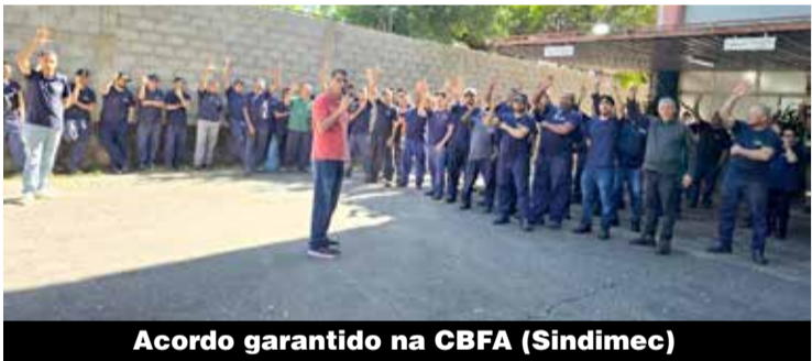
Acordo garantido na CBFA (Sindimec)