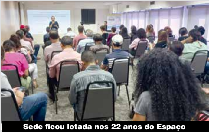
Sede ficou lotada nos 22 anos do Espaço

metalúrgico, ampliou seu alcance e se consolidou como uma rede de atuação coletiva que, a cada ano, mobiliza mais pessoas comprometidas com a defesa de direitos das pessoas com deficiência.