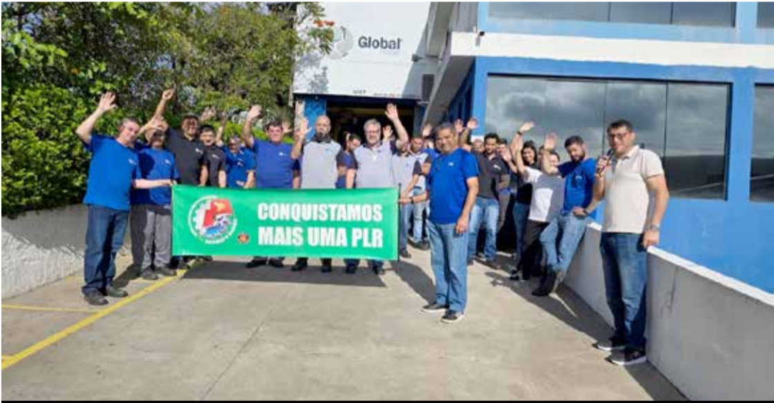
Companheiros da Rematec/Global Moldes conquistaram acordo em dezembro