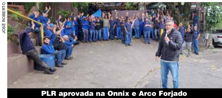
PLR aprovada na Onnix e Arco Forjado