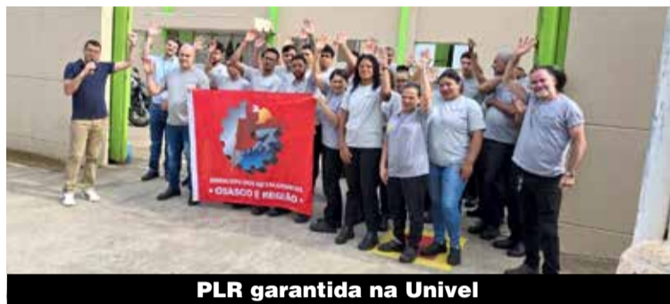
PLR garantida na Univel