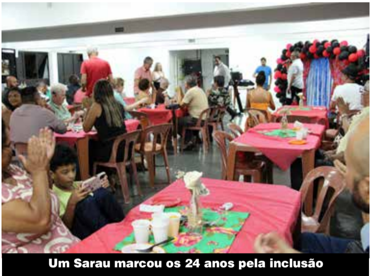
Um Sarau marcou os 24 anos pela inclusão

A diretoria do Sindicato tem mantido firme as negociações por reajuste salarial e convenção coletiva nas fábricas de Osasco e região que são filiadas aos grupos patronais que não fecharam acordo durante a Campanha Salarial. E já garantiu aumento e direitos para os companheiros da Arbame, Blu Eletric, CBFA, Hidrometer, Metalforja/Nascim e Sirius. P3