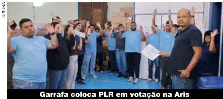
Garrafa coloca PLR em votação na Aris

O destaque fica para o acordo fechado na Bitzer, o valor conquistado equivale a três salários vigentes por trabalhador e foi pago, em parcela única, em 26 de dezembro.