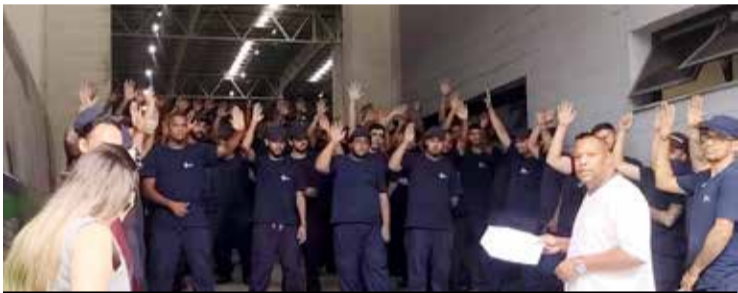
Reajuste também garantido na Blu Eletric (Sinfavea)