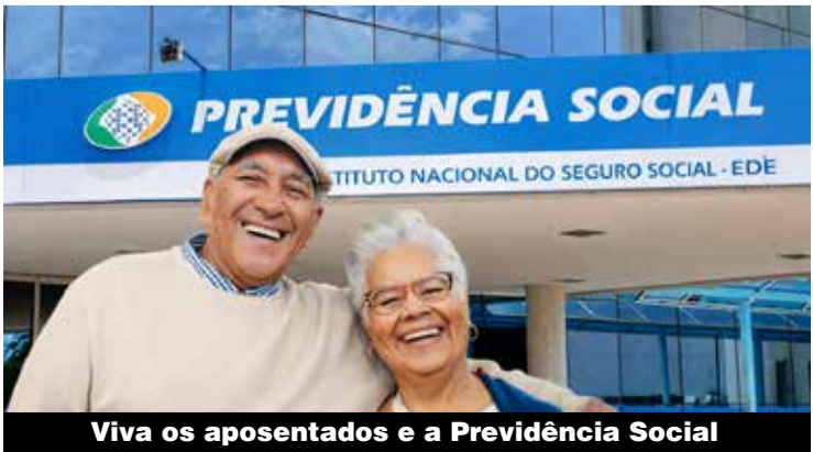
Viva os aposentados e a Previdência Social

Por isso que o Sindicato luta em defesa de uma Previdência pública, solidária e acessível, que garanta proteção social para as atuais e futuras gerações. Assim como pela valorização dos aposentados e das aposentadorias.