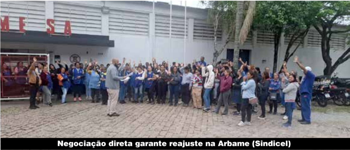
Negociação direta garante reajuste na Arbame (Sindicel)

Se você trabalha em uma das empresas que está sem acordo, fortaleça a mobilização na fábrica e entre em contato com o Sindicato pelo 11 9 6078-020