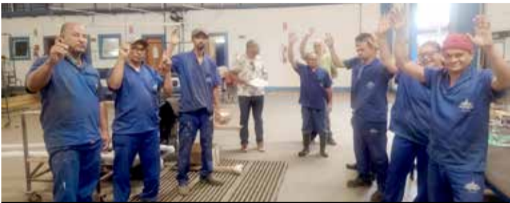
Conquistado reajuste na Sirius (Sindisuper)