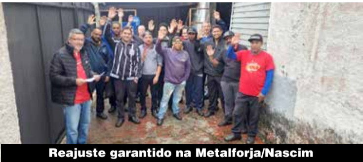
Reajuste garantido na Metalforja/Nascim