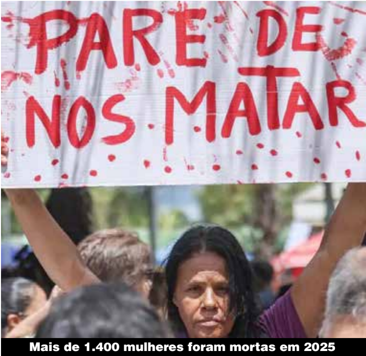
Mais de 1.400 mulheres foram mortas em 2025

Denuncie – Se presenciar uma mulher sendo vítima de violência, denuncie no 180.