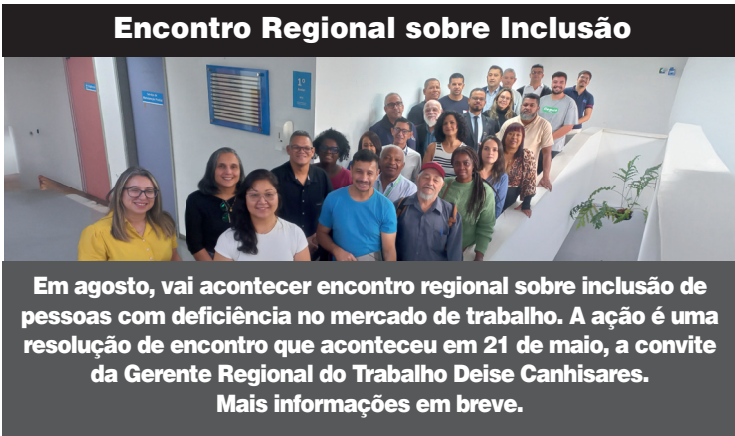
Encontro Regional sobre Inclusão