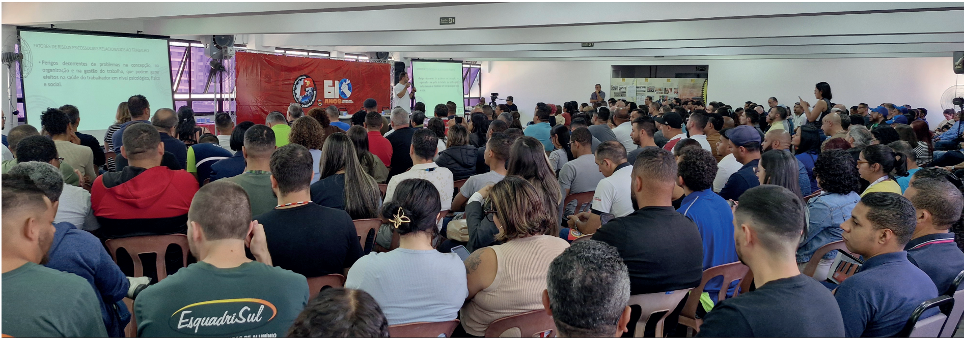
Auditório do Sindicato ficou lotada para o debate que reuniu cipeiros e cipeiras de 90 metalúrgicas de Osasco e região