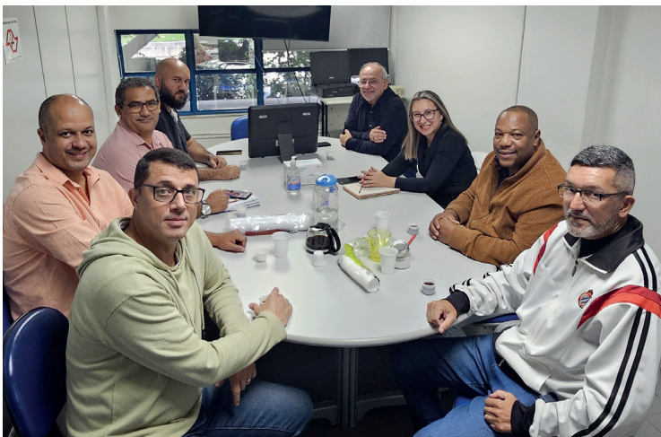
Ação faz parte do Programa de Valorização das CIPAs