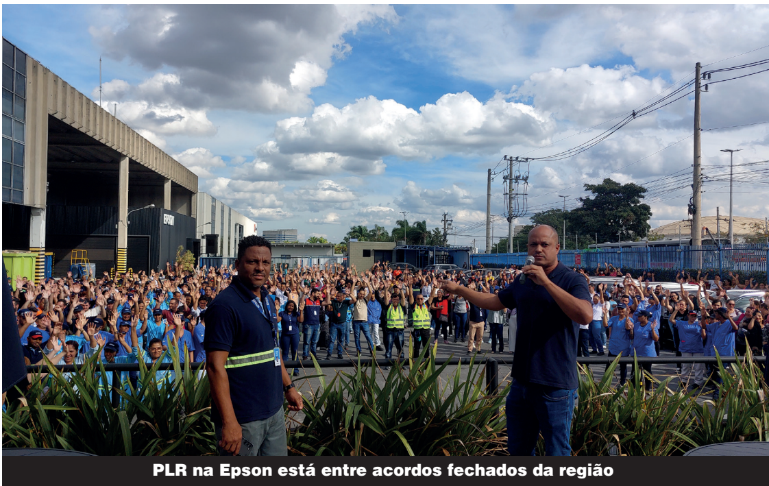
PLR na Epson está entre acordos fechados da região