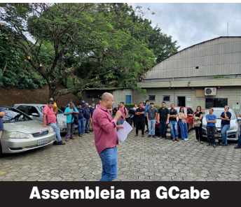
Assembleia na GCabe

dora que trata da segurança no trabalho em máquinas e equipamentos. Ou seja, ela aponta dispositivos necessários de segurança para evitar acidentes.