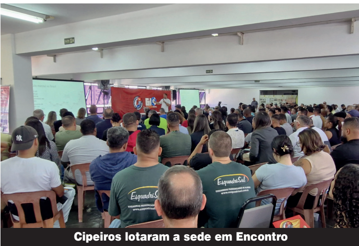
Cipeiros lotaram a sede em Encontro