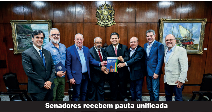
Senadores recebem pauta unificada