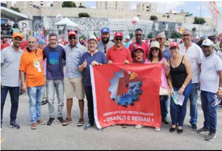
Como nos outros anos, diretoria marcará presença

Para participar do sorteio, basta retirar o seu cupom com um dos diretores do Sindicato, na sede ou nas subdeses. O cupom deve ser preenchido corretamente e depositado em uma das urnas que estarão espalhadas pelo local do evento. Não esqueça de ler as regras descritas nele.