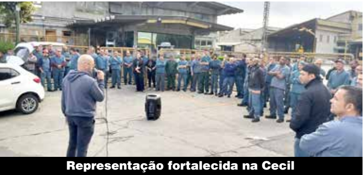
Representação fortalecida na Cecil

Em assembleia, os trabalhadores e as trabalhadoras da Cecil rejeitaram nesta terça-feira, 22, acordo de PLR (Participação nos Lucros e/ou Resultados), negociada entre a empresa e a comissão que ela mesma formou. Além disso, aprovaram a participação do Sindicato nas negociações de PLR e do Acordo Coletivo da data-base, e cobraram por mais transparência na atuação da CIPA.