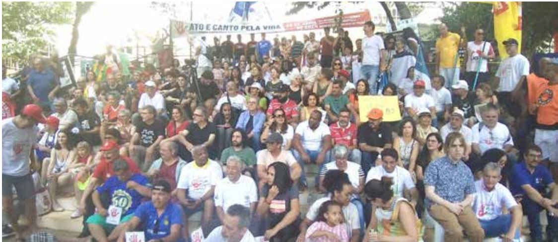
No ano passado, evento lotou a Praça Vladimir Herzog-Centro Cultural a Céu Aberto Elifas Andreato