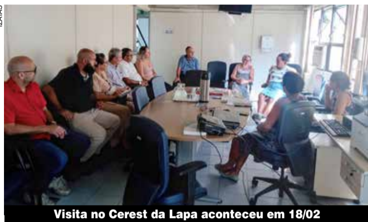
Visita no Cerest da Lapa aconteceu em 18/02

rência Livre Nacional sobre saúde do trabalhador para 3 de abril, com o objetivo de organizar a participação da central na Conferência Nacional de Saúde. O Sindicato está envolvido nos debates.