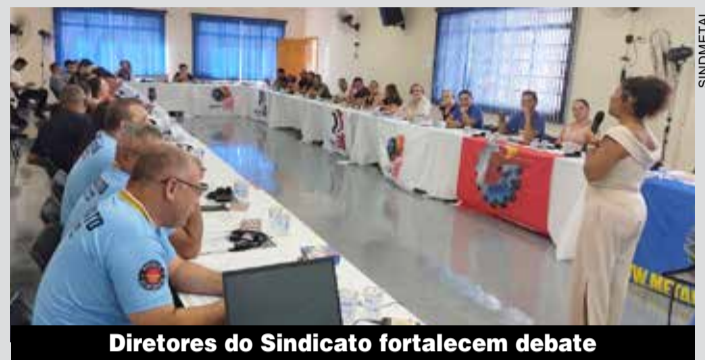
Diretores do Sindicato fortalecem debate