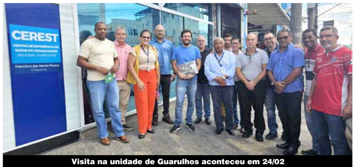
Visita na unidade de Guarulhos aconteceu em 24/02