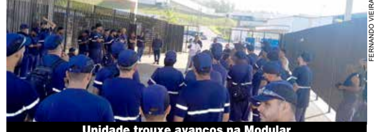
Unidade trouxe avanços na Modular