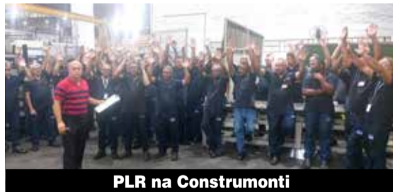
PLR na Construmonti