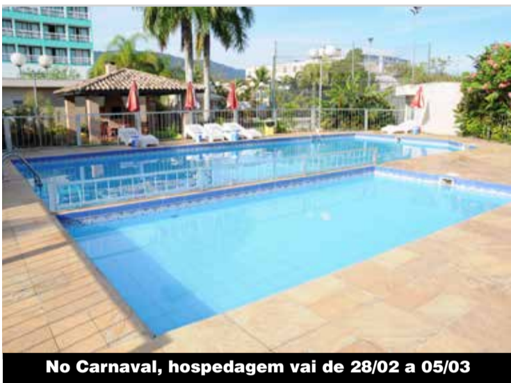
No Carnaval, hospedagem vai de 28/02 a 05/03

Na Konecranes e Grupo JL, a mobilização foi para a de 2024 não passar em branco. Também nesta edição, Sindicato fecha acordo de troca de feriado. P.3