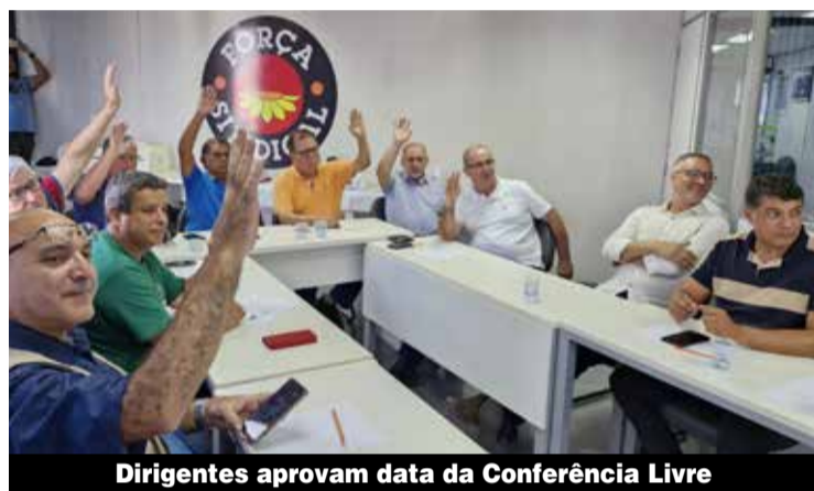
Dirigentes aprovam data da Conferência Livre