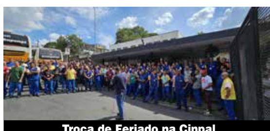
Troca de Feriado na Cinpal