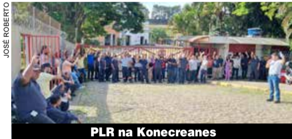
PLR na Konecranes

ras da Danfoss do Brasil e Danfoss Power Solutions aprovaram Compensação de Dias Pontes 2025. Na Bomax, Metalsa, Cinpal Minor, Top Taylor e Valvugás, os trabalhadores e trabalhadoras aprovaram a troca de dias de feriados.