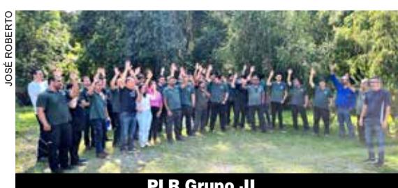
PLR Grupo JL