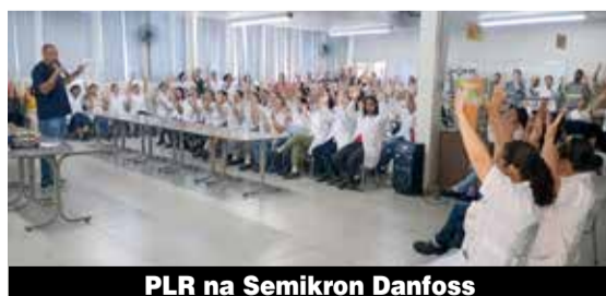
PLR na Semikron Danfoss