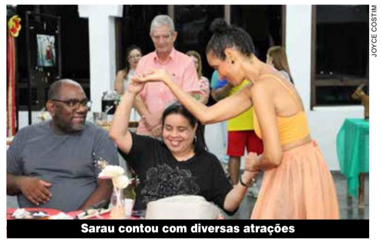
Sarau contou com diversas atrações

O Espaço da Cidadania foi inaugurado em 14 de fevereiro de 2001 com a finalidade de estimular o debate sobre políticas públicas voltadas para a igualdade de oportunidades, e rapidamente ampliou sua atuação na inclusão.