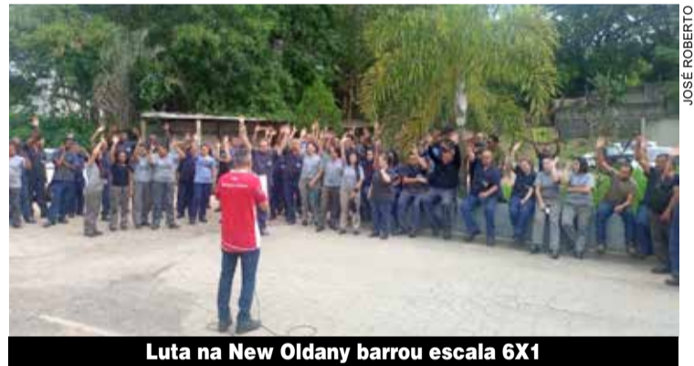
Luta na New Oldany barrou escala 6X1