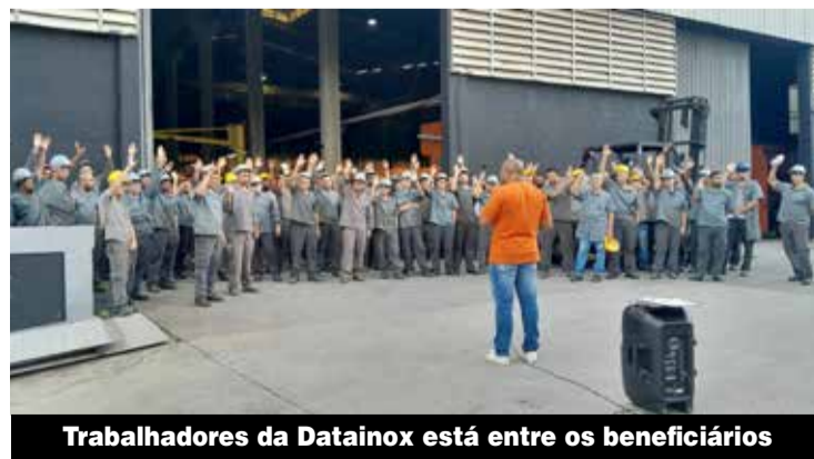
Trabalhadores da Datinox está entre os beneficiários