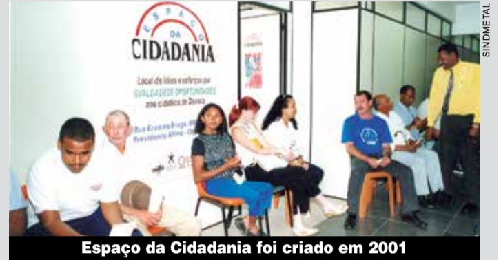
Espaço da Cidadania foi criado em 2001

Neste ano, o Espaço da Cidadania completa 24 anos de luta e compromisso pela inclusão das pessoas com deficiência no mercado de trabalho. Para celebrar esta marca, o Espaço da Cidadania e seus parceiros pela inclusão organizam o "Sarau da Diversidade", que vai acontecer em 14 de fevereiro (sexta-feira), a partir das 18h, no Sindicato.