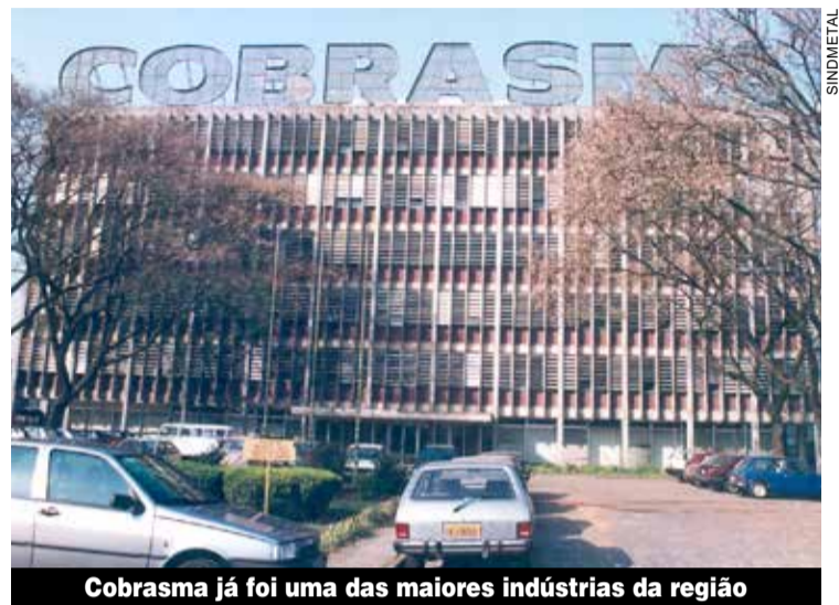
Cobrasma já foi uma das maiores indústrias da região

Alguns meses após a compra, a Câmara Municipal de Osasco aprovou a mudança no zoneamento onde fica o terreno, passando de área industrial para mista, mudança que pode provocar a saída das indústrias do local.