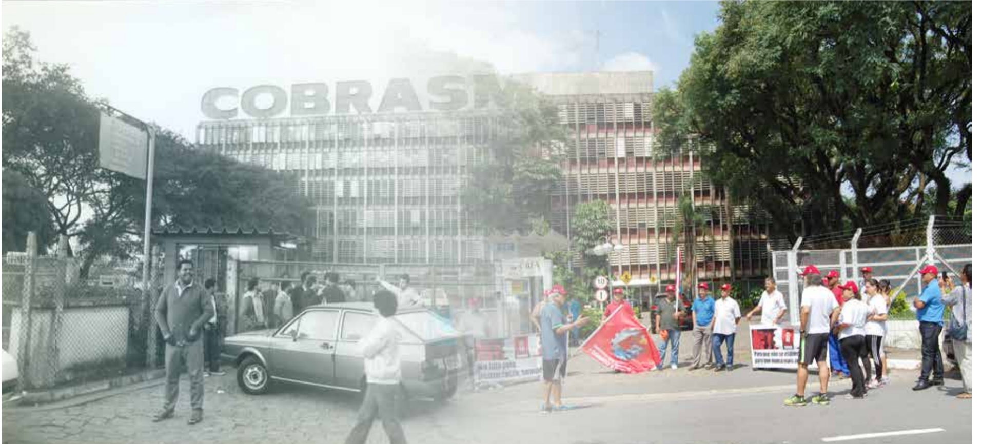
Terreno havia sido arrematado em leilão no valor de quase R$ 200 milhões para cumprir uma determinação de ação trabalhista