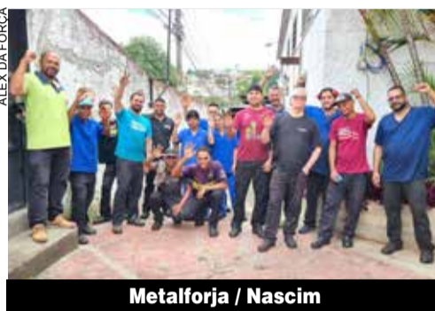
Metalforja / Nascim