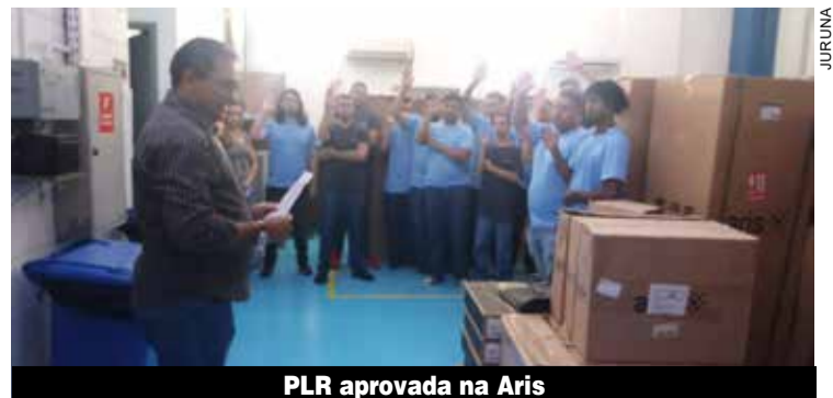
PLR aprovada na Aris