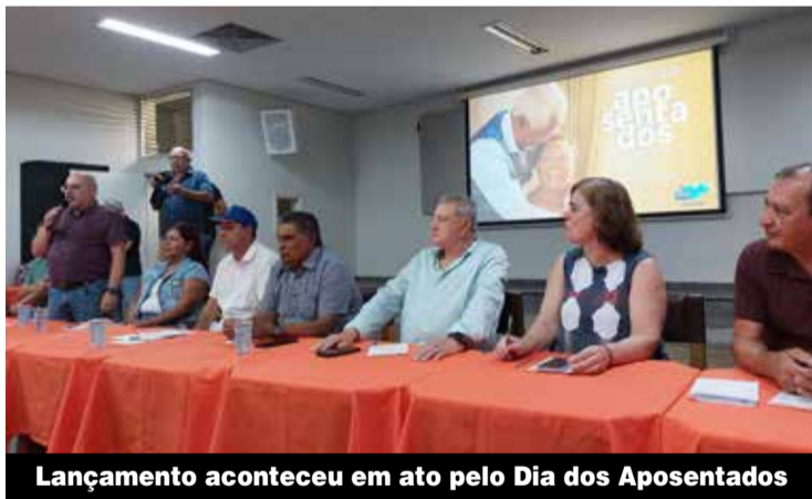
Lançamento aconteceu em ato pelo Dia dos Aposentados

Iniciativa busca aproximar os aposentados das inovações tecnológicas e promover novas oportunidades de aprendizado P.4