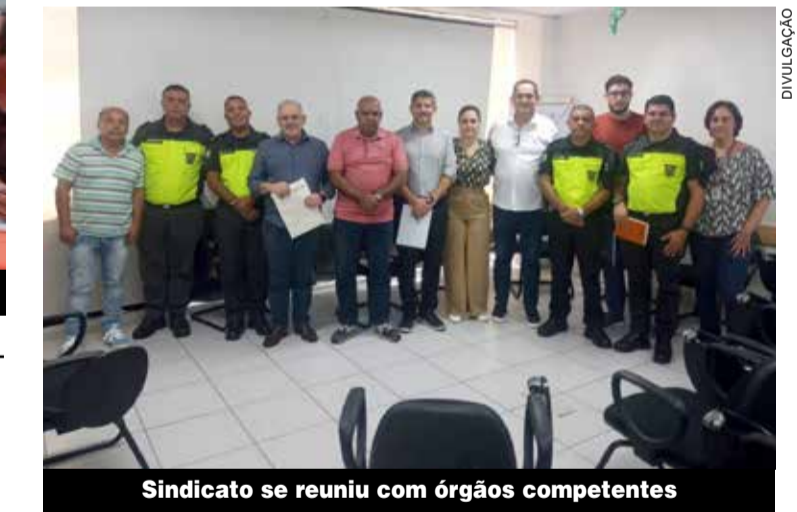
Sindicato se reuniu com órgãos competentes