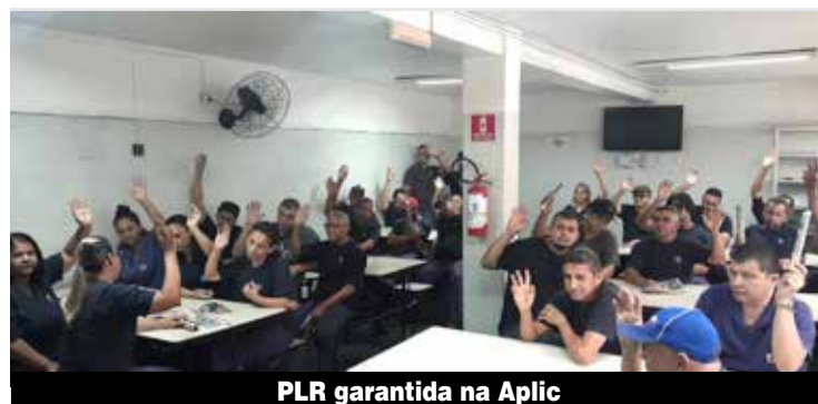
PLR garantida na Aplic