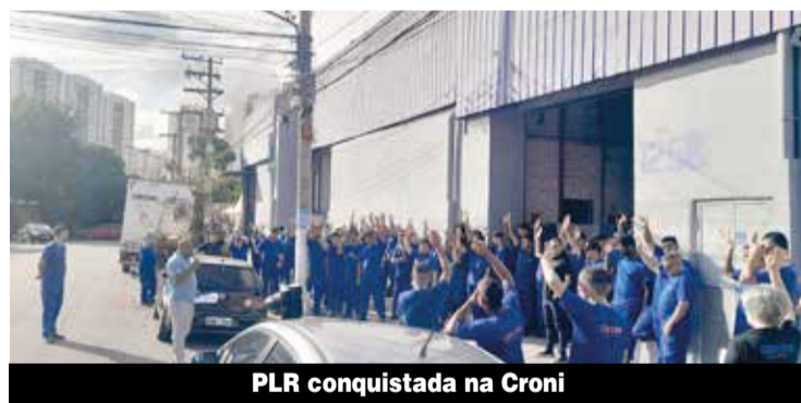
PLR conquistada na Croni

PLR - O final de 2024 e o início de 2025 foi marcado por intensas mobilizações nas fábricas da região por PLR que renderam acordos na Croni, na Bitzer, na Orgus, na Aris, na Multivisão e na Aplic.