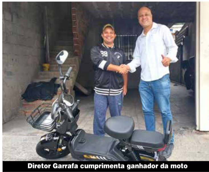
Diretor Garrafa cumprimenta ganhador da moto

“Eu nem acreditei quando ele me ligou. A gente ficou feliz e isso estimula a gente a participar mais”, declarou a companheira.