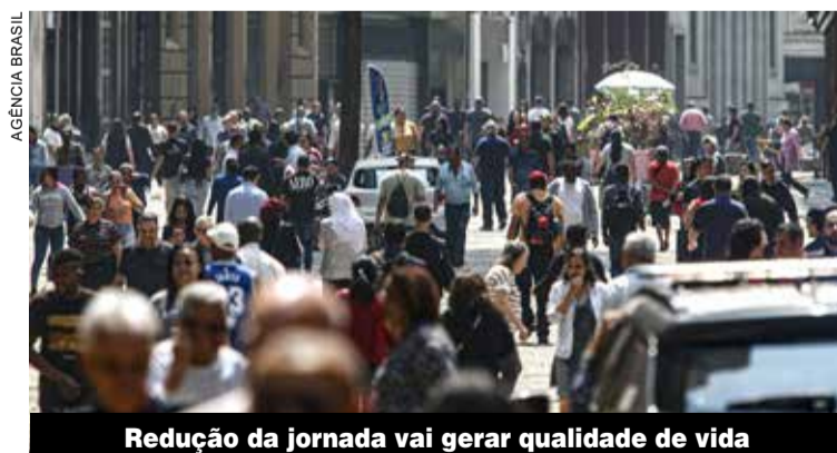
Redução da jornada vai gerar qualidade de vida

PEC do fim da escala 6x1 avança para o Congresso