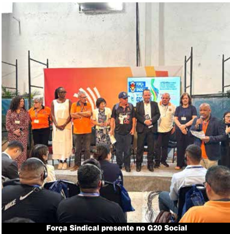
Força Sindical presente no G20 Social