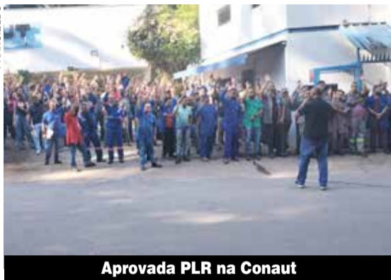
Aprovada PLR na Conaut

Já na Kitframe, além de garantir a PLR, que será paga em janeiro de 2025, parcela única, os trabalhadores e trabalhadoras conquistaram reajuste de 12,5% no vale-alimentação.