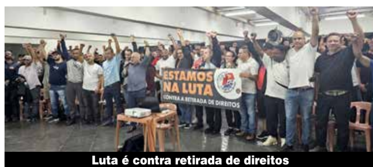
Luta é contra retirada de direitos

“São direitos importantes, principalmente quando o trabalhador ou a trabalhadora é demitido. Por isso pedimos atenção de todos. Nós, dirigentes sindicais, estamos de olho, vamos pedir reunião com Lula