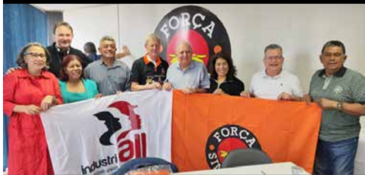
Dirigentes da Força Sindical e representantes da IndustriALL Global Union se reuniram na quarta-feira, 6, para elaborar um documento dentro do contexto dos debates da Nova Política Industrial do Governo Lula, com o objetivo fortalecer a indústria nacional.