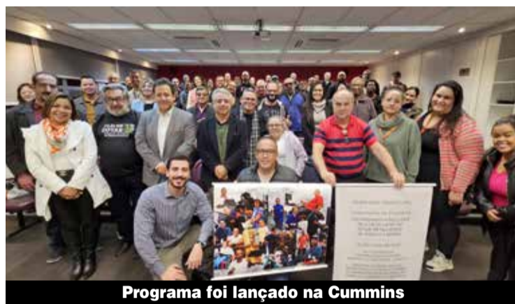
Programa foi lançado na Cummins

Ficaram fora do Programa as empresas que já atendiam as exigências legais desde o início do ano. “O nosso traba-