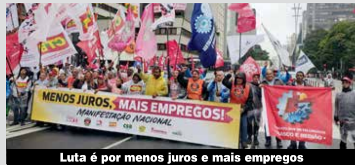
Luta é por menos juros e mais empregos

Em nota, a Força Sindical expressou indignação com a decisão do Copom (Comitê de Política Monetária), do Banco Central, de aumentar em 0,5% a taxa básica de juros da economia brasileira (Selic), passando de 10,75% para 11,25% ao ano. Essa decisão atende apenas ao mercado, e prejudica a vida da classe trabalhadora.