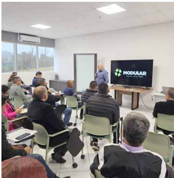
Programa foi avaliado em encontro na Modular