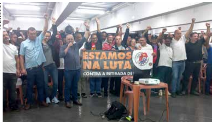
Em assembleia, defenderam FGTS e seguro-desemprego