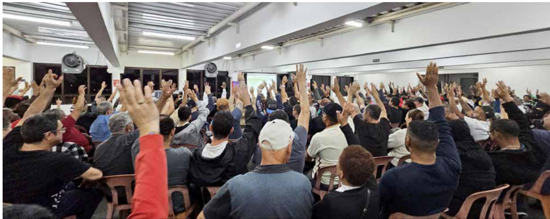
Em assembleia, na sede, metalúrgicos e metalúrgicas de Osasco e região aprovaram proposta feita pelos patrões de Autopeças

Proposta inclui aumento real de 1,2% e é base para demais grupos P.2 e 3