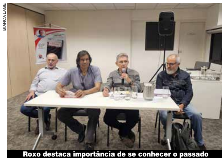
Roxo destaca importância de se conhecer o passado

Livro com olhar econômico e político sobre a Cobrasma é lançado na sede P.3