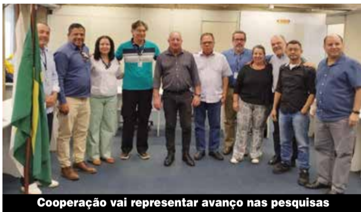
Cooperação vai representar avanço nas pesquisas