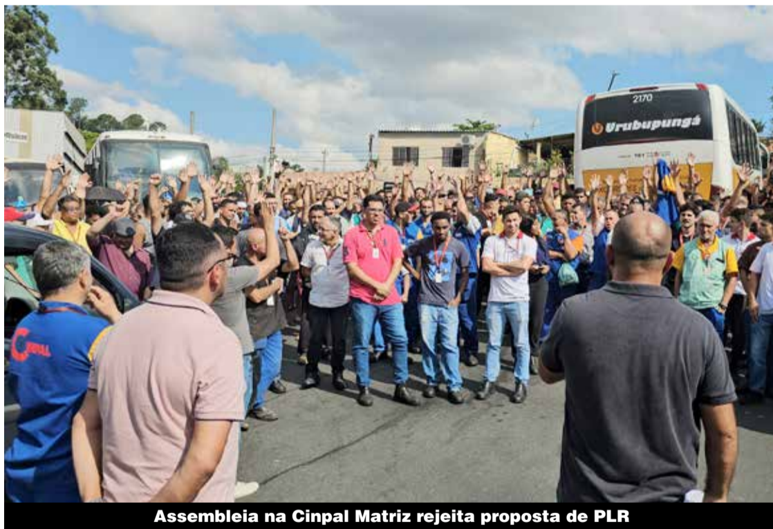
Assembleia na Cinpal Matriz rejeita proposta de PLR

Os trabalhadores e trabalhadoras da Cinpal Matriz, Fábrica 2 e 3 rejeitaram a proposta de PLR feita pela empresa. Agora, aguardam uma contraproposta melhor. Veja também nesta edição: a mobilização dos companheiros da Engrecon por uma proposta melhor de PLR, e acordos fechados nos últimos dias. P.4