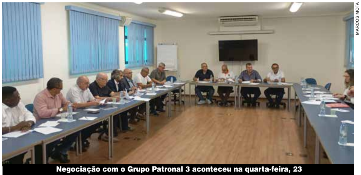
Negociação com o Grupo Patronal 3 aconteceu na quarta-feira, 23

“Continuaremos a intensificar as assembleias nas portas de fábricas, neste momento é preciso que a categoria continue mobilizada, para aumentar a pressão na mesa de nego-