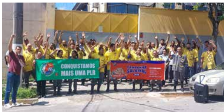
PLR garantida na Little House e Lithe Indústria