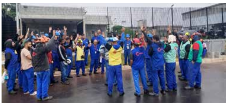
Assembleia na Cinpal Fábrica 3 rejeita proposta de PLR