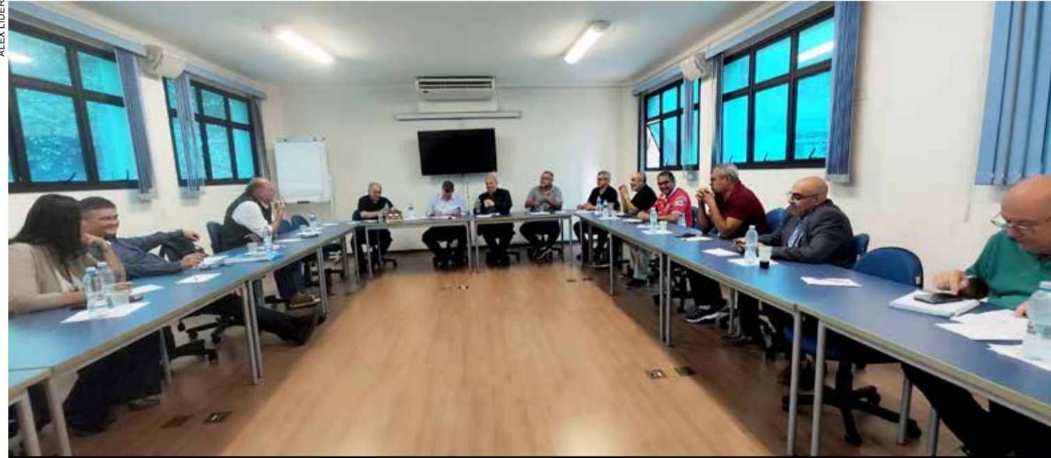
Comissão de negociação da Campanha Salarial discute reivindicações com os setores de Máquinas e de Elétricos e Eletrônicos

Data base é nesta sexta, 1, categoria deve ficar atenta ao chamado do Sindicato