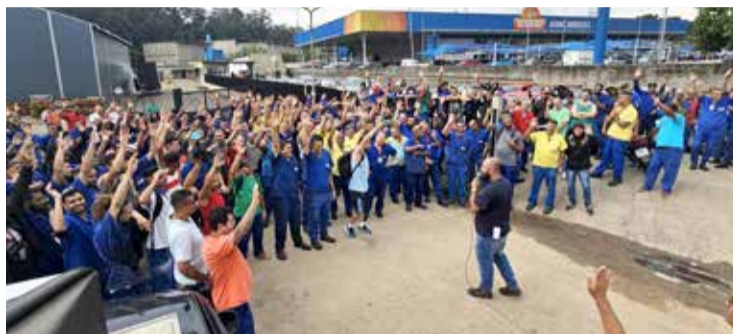
Assembleia na Cinpal Fábrica 2 rejeita proposta de PLR

Na Nylok, o pagamento será feito em duas parcelas. A primeira em novembro e a segunda em abril de 2025, após a verificação do atingimento das metas. Na Little House e Lithe Indústria, além da PLR, foi conquistado a correção do VR (Vale Refeição) e do VA (Vale Alimentação), que vai acontecer sempre em janeiro, pelo mesmo índice de reajuste da campanha salarial.