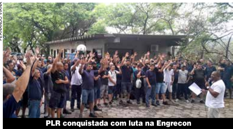
PLR conquistada com luta na Engrecon

Foi por meio da luta que os companheiros e companheiras da Engrecon conquistaram melhorias no valor da PLR. Na sexta-feira, 25, em assembleia, eles rejeitaram a proposta inicial apresentada pela empresa e entraram em greve até que o valor foi aumentado em mais de 20%.