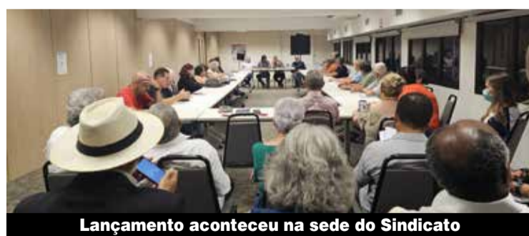
Lançamento aconteceu na sede do Sindicato