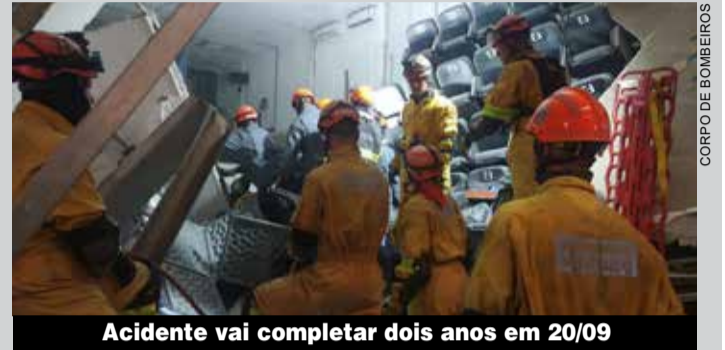
Acidente vai completar dois anos em 20/09

O Governo Federal respondeu a carta aberta enviada pelo Sindicato ao presidente Luiz Inácio Lula da Silva sobre a tragédia acidentária na Multiteiner, em Itapecerica da Serra. Com o questionamento “Nove vidas importam?”, a carta chama atenção de Lula para o acidente que, apesar de ter matado nove pessoas e deixado outras 28 feridas, segue impune.