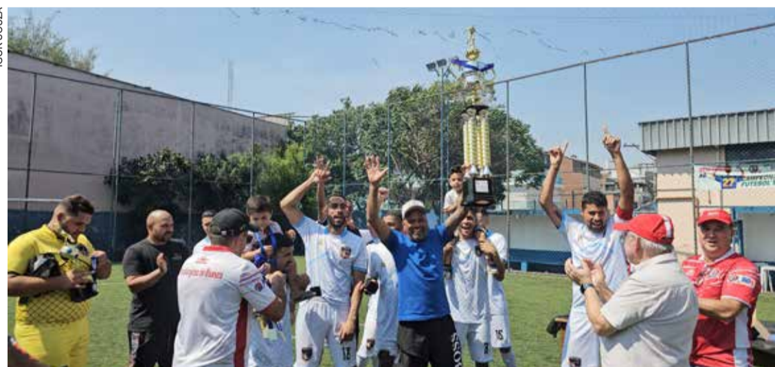
Cinpal comemora vitória; time também levou o troféu de artilheiro e goleiro menos vazado P.4