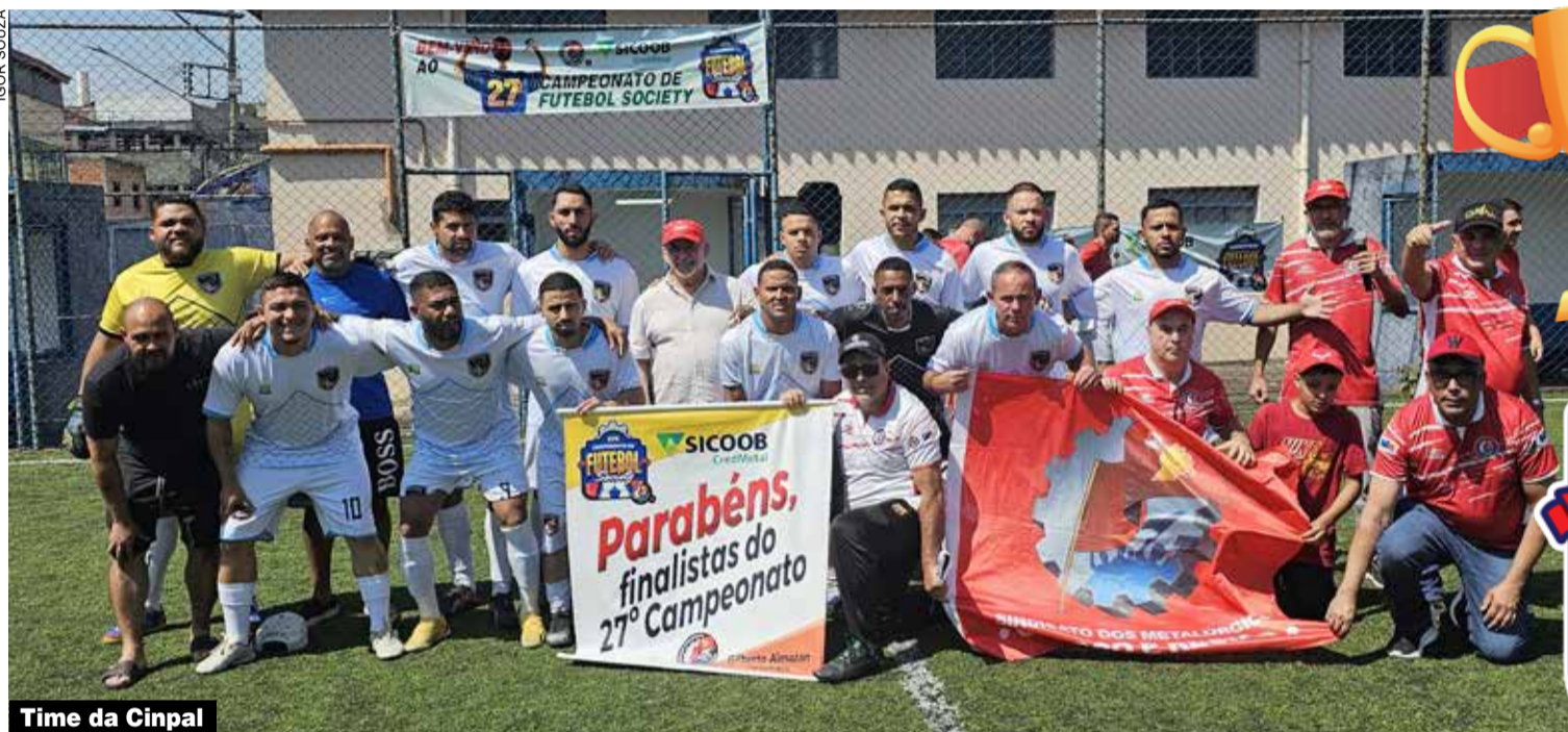
Time da Cinpal