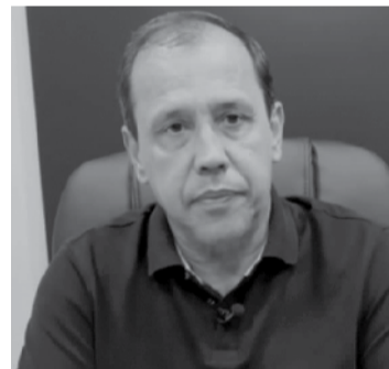
MILTON CAVALO, Presidente do Sindicato Nacional dos Aposentados, Pensionistas e Idosos - Sindnapi

é de medidas que lhe garantam o poder aquisitivo e promovam uma melhora em sua condição de vida. Recomposição dos benefícios acima do salário mínimo e políticas públicas de valorização seriam muito mais efetivas.