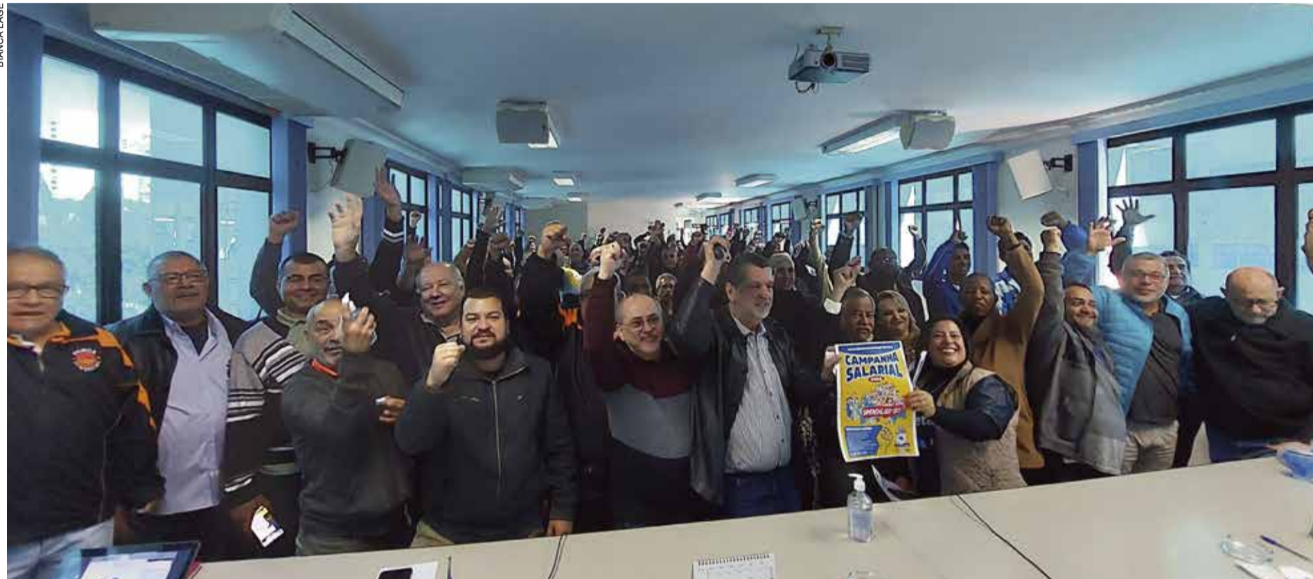
Assembleia na Federação reuniu 54 sindicatos do Estado de São Paulo e aprovou início da Campanha deste ano

Metalúrgicos de Osasco e região terão seminário em 14 de setembro na sede do Sindicato P.2 e 3