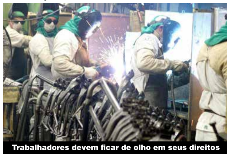
Trabalhadores devem ficar de olho em seus direitos