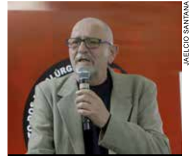
Magrão relembra seu mandato