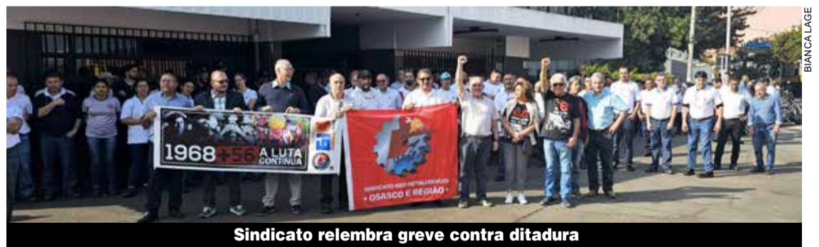
Sindicato relembra greve contra ditadura

Os 56 anos da a Greve de Osasco, que em 16 de julho de 1968 parou diversas fábricas da cidade, foi lembrada em assembleia realizada na Cummins Meritor. A Cobrasma, local onde se iniciou a greve, ficava exatamente no mesmo local onde, hoje, funciona a Cummins.