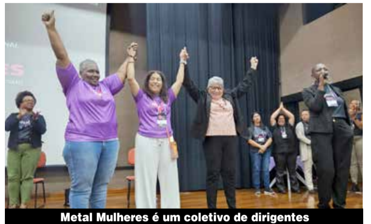
Metal Mulheres é um coletivo de dirigentes

2025 – Uma das deliberações da 2ª Conferência foi marcar uma terceira edição para o ano que vem. A proposta foi aprovada por unanimidade. [Com informações de Agências Sindicais]