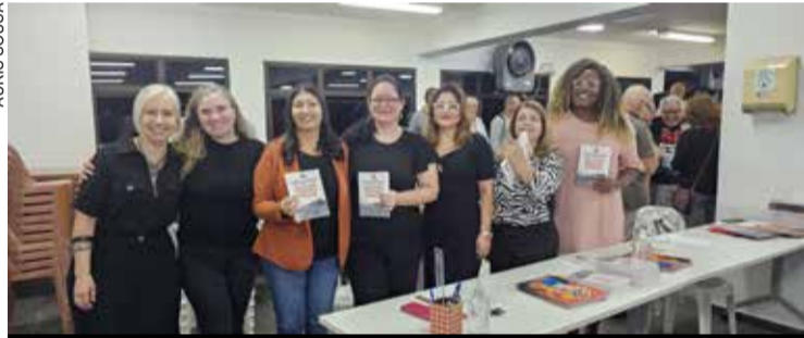
Trabalhadoras do Sindicato recebem família metalúrgica