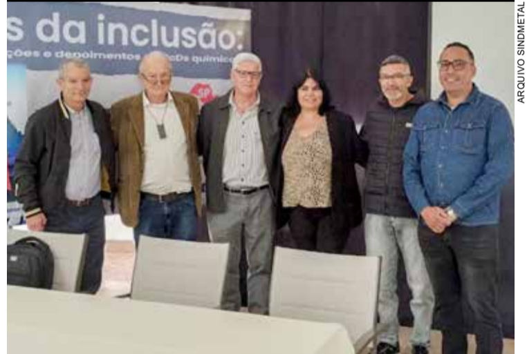
O Sindicato fez questão de assistir ao lançamento do "Os desafios da inclusão: informações e desafios de PcDs químicos" que aconteceu, em 20 de julho, no Cefol Campinas