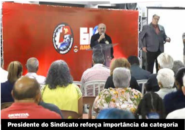
Presidente do Sindicato reforça importância da categoria