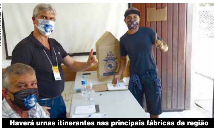
Haverá urnas itinerantes nas principais fábricas da região