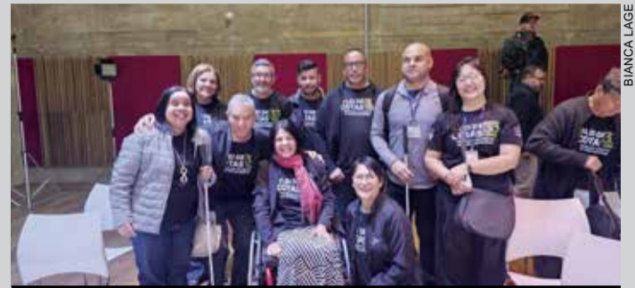
Celebração aconteceu na Praça das Artes

Foi com o auditório lotado que empresas, sindicatos, representantes governamentais e população se reuniram para comemorar os 33 anos da Lei de Cotas. O encontro refletiu e reforçou a importância da Lei.