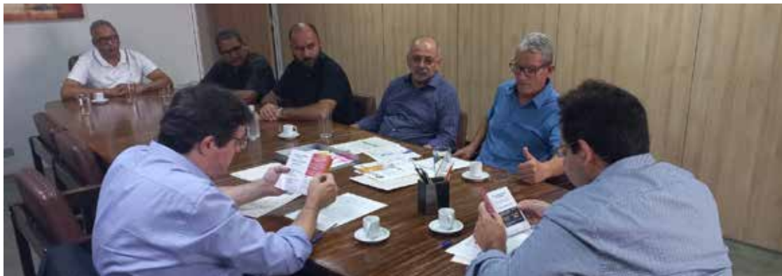
Reunião tratou do cumprimento da Lei de Cotas