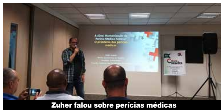
Zuher falou sobre perícias médicas

“O encontro foi bem explicativo”, destacou um trabalhador da Cinpal. “Achei ótimo, e vou precisar de vocês”, enfatizou uma companheira da Elubel.