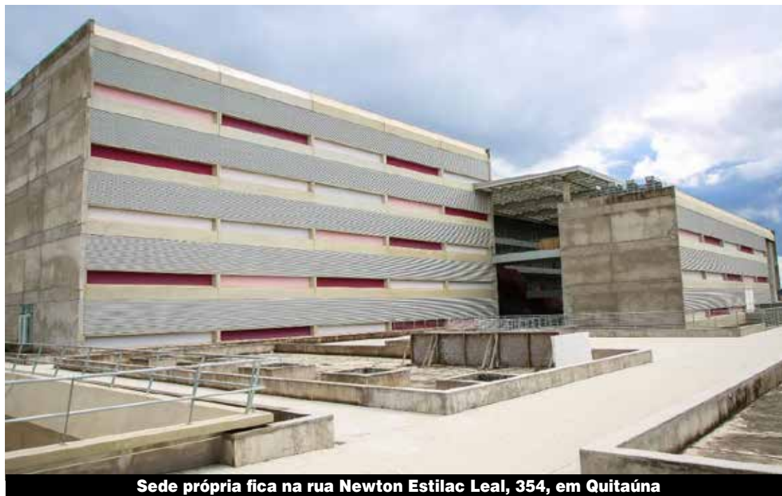
Sede própria fica na rua Newton Estilac Leal, 354, em Quitaúna

Com capacidade para aproximadamente 3 mil alunos, o novo campus terá mais de 30 salas de aula, além de uma variedade de laboratórios, anfiteatros, auditório, praça digital, estacionamento e área de convivência. Este complexo educacional representa um significativo progresso para a educação, beneficiando não apenas a cidade Osasco, mas também toda a região Oeste.