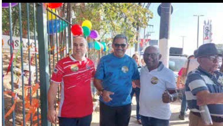
Em 22 de junho, o Sindicato participou do lançamento da campanha “Osasco Berço da Aviação Nacional”, lançada pelo Modephac (Movimento em Defesa do Patrimônio Histórico, Artístico e Cultural de Osasco). No mesmo dia, foi celebrado os 48 anos do Museu Dimitri Sensaud de Lavau, que recebeu um abraço simbólico