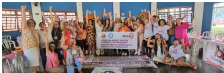
O coletivo Metal Mulheres foi formado em 2019, reúne companheiras dirigentes dos sindicatos dos metalúrgicos de Osasco, São Paulo, Guarulhos, Jundiá, Baixada Santista, Santo André, São Caetano do Sul, São José do Rio Preto, Cerquilha, Grande Curitiba e Santa Rita do Sapucaí.

Misoginia e Discriminação Racial - Impactos no Trabalho e Vida da Trabalhadora” e “Igualdade Salarial entre Mulheres e Homens - Impactos e Resistências”.