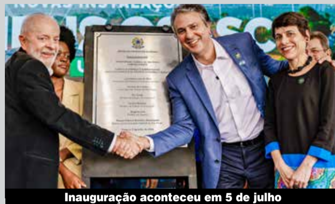
Inauguração aconteceu em 5 de julho

O Presidente do Brasil, Luiz Inácio Lula da Silva, esteve em 5 de julho em Osasco para a inauguração da sede própria da Unifesp (Universidade Federal de São Paulo). Os Ministros da Fazenda, Fernando Haddad, da Educação, Camilo Santana, e das Relações Institucionais, Alexandre Padilha, estiveram na cerimônia de inauguração.