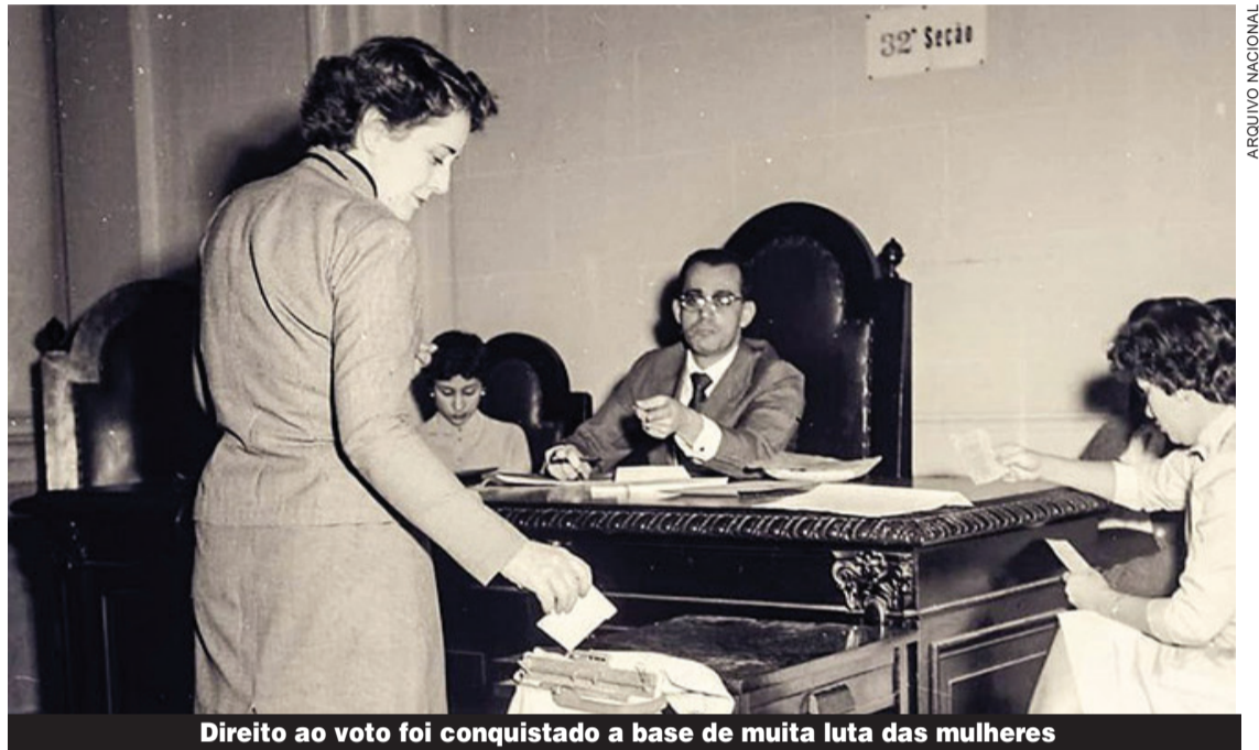
Direito ao voto foi conquistado a base de muita luta das mulheres

Segundo a União Interparlamentar, no ranking de representatividade feminina na política, o Brasil ocupa a posição 131 de 193 países pesquisados. Em 2020, o país teve mais de 90 mil registros de candidatura em cargos municipais, sendo 33,50% de mulheres. Foram eleitas, 15,40% no estado de São Paulo, ou seja, 1.055 vereadoras, diante de 5.637 vereadores. No país todo, foram 9 mil mulheres.