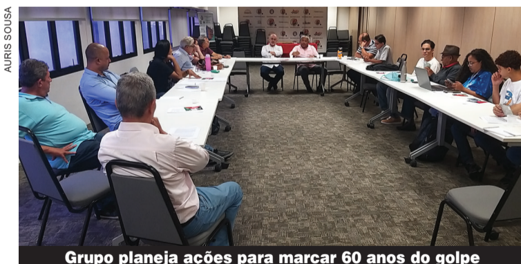
Grupo planeja ações para marcar 60 anos do golpe

A programação já terá início no dia 9 de março, quando