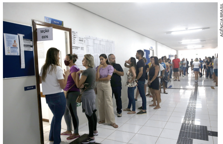
No Brasil, mulheres são 53% do eleitorado