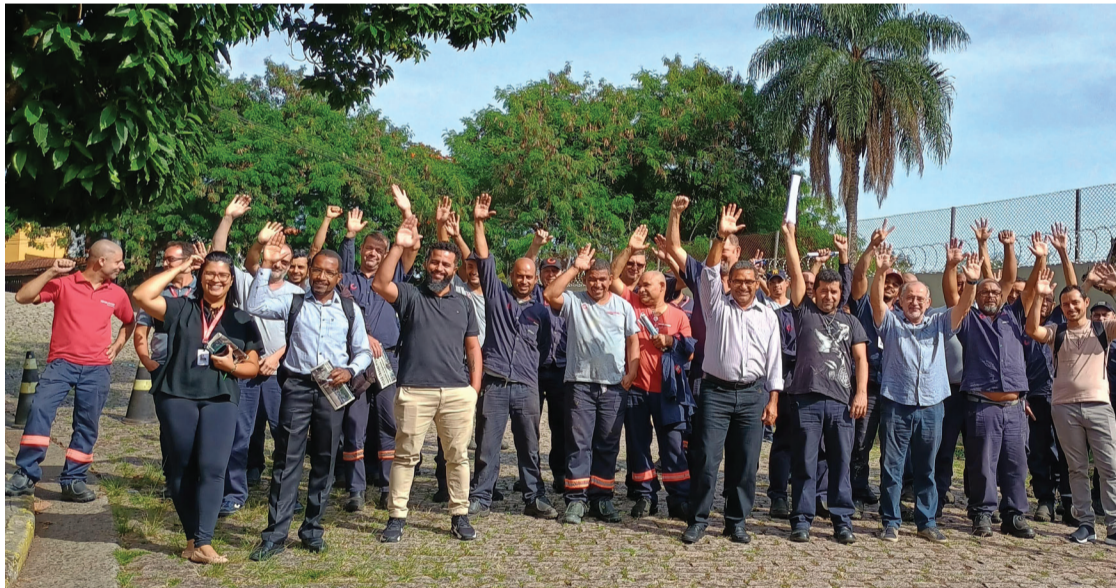
Na Konecranes, acordo de PLR é comemorado

Na Konecranes, a organização garantiu a PLR de 2023. P.3