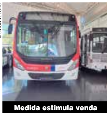
Medida estimula venda

Mercedes-Benz vende ônibus dentro do programa do governo P.2