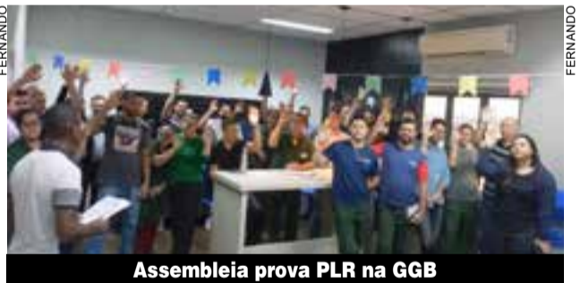
Assembleia prova PLR na GGB