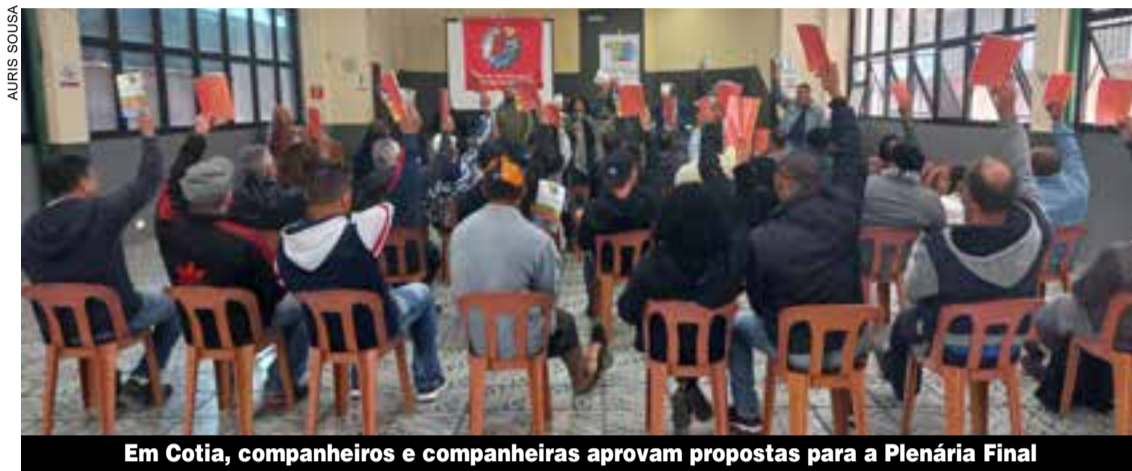
Em Cotia, companheiros e companheiras aprovam propostas para a Plenária Final

Alguns trabalhadores compartilharam suas experiências e dificuldades cotidianas no local de trabalho, ressaltaram a importância de fortalecer o Sindicato e todos os participantes, divididos em grupos, fizeram propostas. Na sede, os trabalhadores de Barueri, Itapevi, Santana de Parnaíba e Pirapora do Bom Jesus fizeram propostas relaciona-