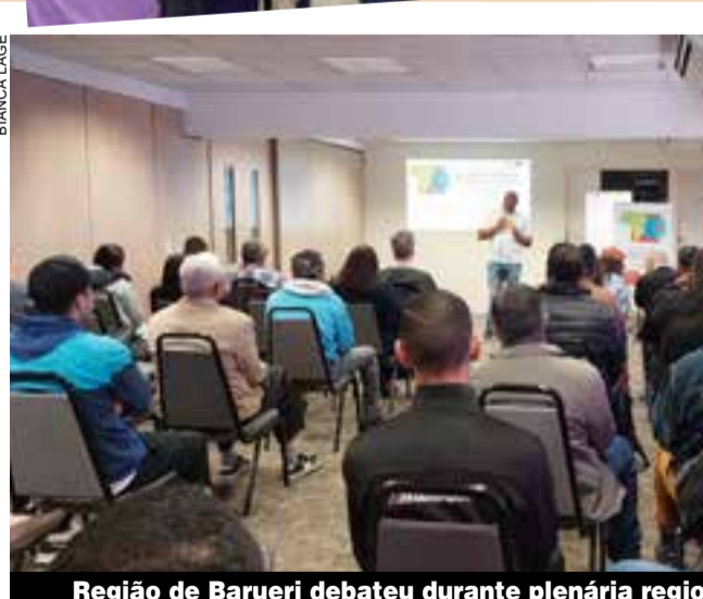
Região de Barueri debateu durante plenária regional