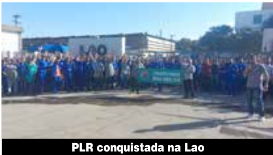
PLR conquistada na Lao

Tem acordo de PLR (Participação nos Lucros e Resultados) garantido para os metalúrgicos e metalúrgicas da Brasforno, GGB, Grantampa, CBFA, Lao e Promaquina, que também aprovou banco de horas. A conquista veio por meio