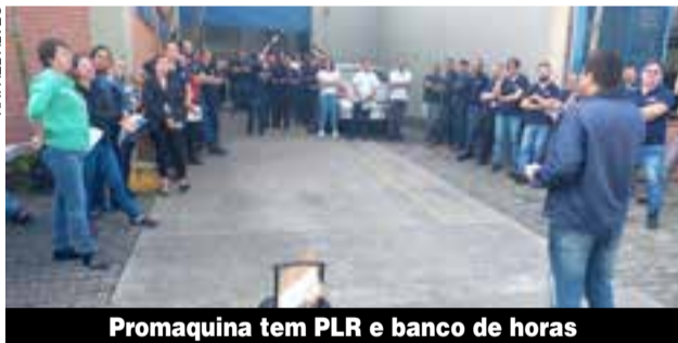
Promaquina tem PLR e banco de horas