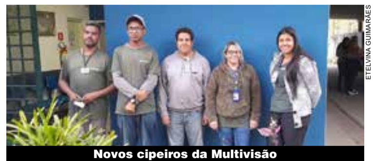
Novos cipeiros da Multivisão