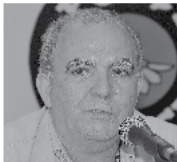
MIGUEL TORRES Presidente da Força Sindical, CNTM e Sindicato dos Metalúrgicos de São Paulo e Mogi das Cruzes

e a extrema-direita e continuamos na luta pelo desenvolvimento do País para o povo brasileiro. A luta faz a lei!