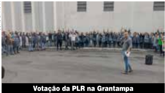
Votação da PLR na Grantampa