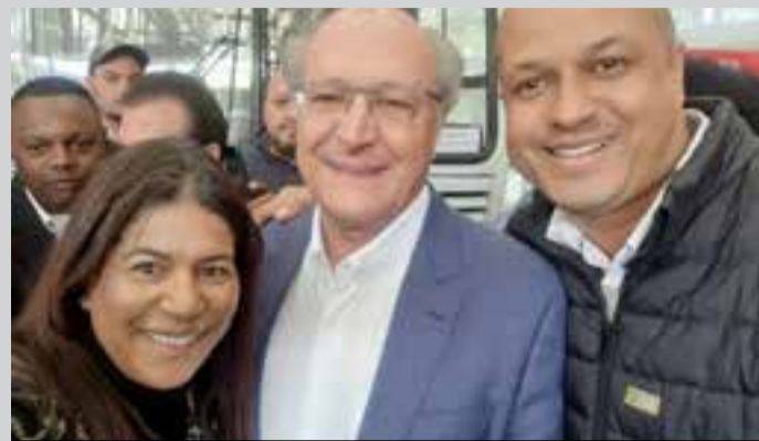
Mônica, Alckmin e Garrafa na Mercedes-Benz

A Mercedes-Benz anunciou na sexta-feira, 14, a venda de 110 ônibus dentro da MP (Medida Provisória) 1175/ 2023, que trata do incentivo à indústria automotiva e renovação de frota. O anúncio foi feito nas presenças do vice-presidente da República e ministro do Desenvolvimento, Indústria, Comércio e Serviços (MDIC), Geraldo Alckmin, e do ministro do Trabalho e Emprego, Luiz Marinho, na sede da empresa.