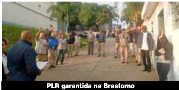
PLR garantida na Brasforno