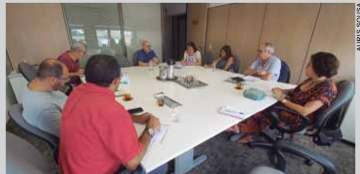
Professores apresentam Pesquisa sobre a Cobrasma

Já em fase final, o relatório da Pesquisa deve ser divulgado para a população de Osasco em agosto deste ano. O objetivo é jogar luz sobre os crimes cometidos por empresas e também embasar futuras ações de reparação coletiva pelo Ministério Público Federal.