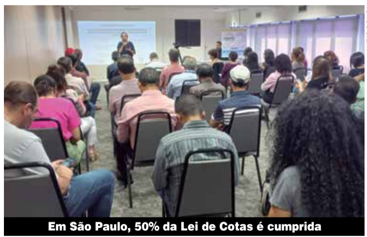
Em São Paulo, 50% da Lei de Cotas é cumprida