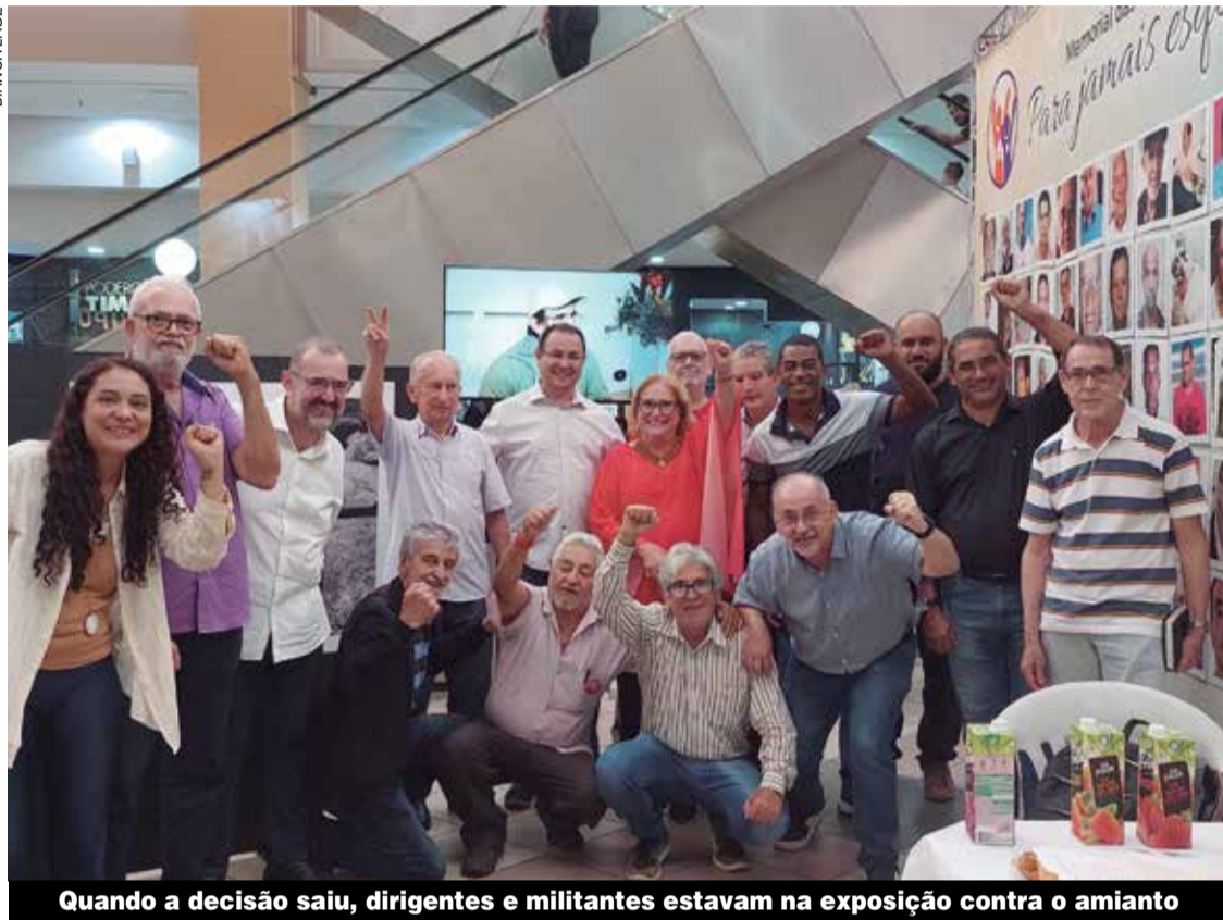
Quando a decisão saiu, dirigentes e militantes estavam na exposição contra o amianto

O STF (Supremo Tribunal Federal) manteve na quinta-feira, 23, a proibição da extração, da industrialização, da comercialização e da distribuição do amianto crisólita no país. A decisão foi comemorada por diversos militantes que prestigiavam a abertura da exposição “Memorial das Vítimas do Amianto”, no Osasco Plaza Shopping.