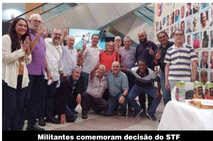
Militantes comemoram decisão do STF