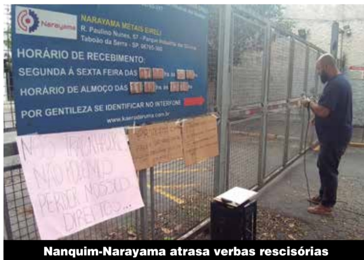
Nanquim-Narayama atrasa verbas rescisórias