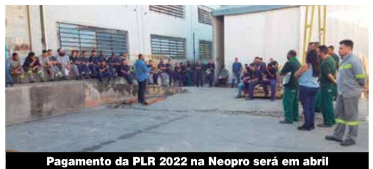
Pagamento da PLR 2022 na Neopro será em abril