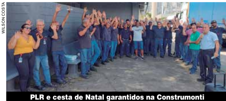
PLR e cesta de Natal garantidos na Construmonti

No Grupo JL, o pagamento vai acontecer até o dia 10 de março. Na Nylok, será feito até junho. Já na Neopro, será em abril.