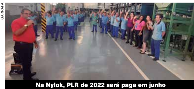
Na Nylok, PLR de 2022 será paga em junho