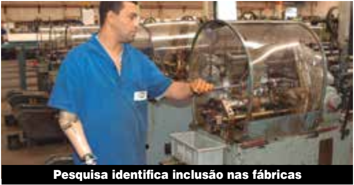
Pesquisa identifica inclusão nas fábricas

Uma reunião online da diretoria do Sindicato marcou na sexta-feira, 18, o início da organização para a Pesquisa sobre contratação de pessoas com deficiência no setor metalúrgico de Osasco e região. Realizada anualmente, a Pesquisa apresenta um raio-x da presença de trabalhadores com deficiência na metalurgia da região. A última, edição 16º, mostrou que o índice de contratações atingiu a marca de 85,0% em 2021. O estudo tem como base os questionários respondidos por empresas metalúrgicas, localizadas em Osasco e região, que têm mais de 100 trabalhadores. Espaço da Cidadania – Na próxima sexta-feira, 25, acontece o Encontro Anual do Espaço da Cidadania e seus parceiros pela inclusão. Neste ano, o encontro acontece no auditório do Sincovaga, no centro de São Paulo, das 9h às 12h. Inscrições abertas – Vão até quarta-feira, 23, as inscrições para o Diálogo sobre Diversidade: Trabalho, Raça e Deficiência, que acontece em 30 de novembro pelo aplicativo Zoom. As inscrições devem ser feitas pelo e-mail ecidadania@ecidadania.org.br