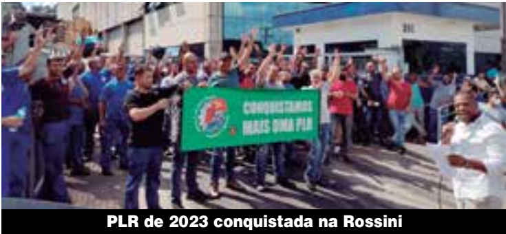
PLR de 2023 conquistada na Rossini