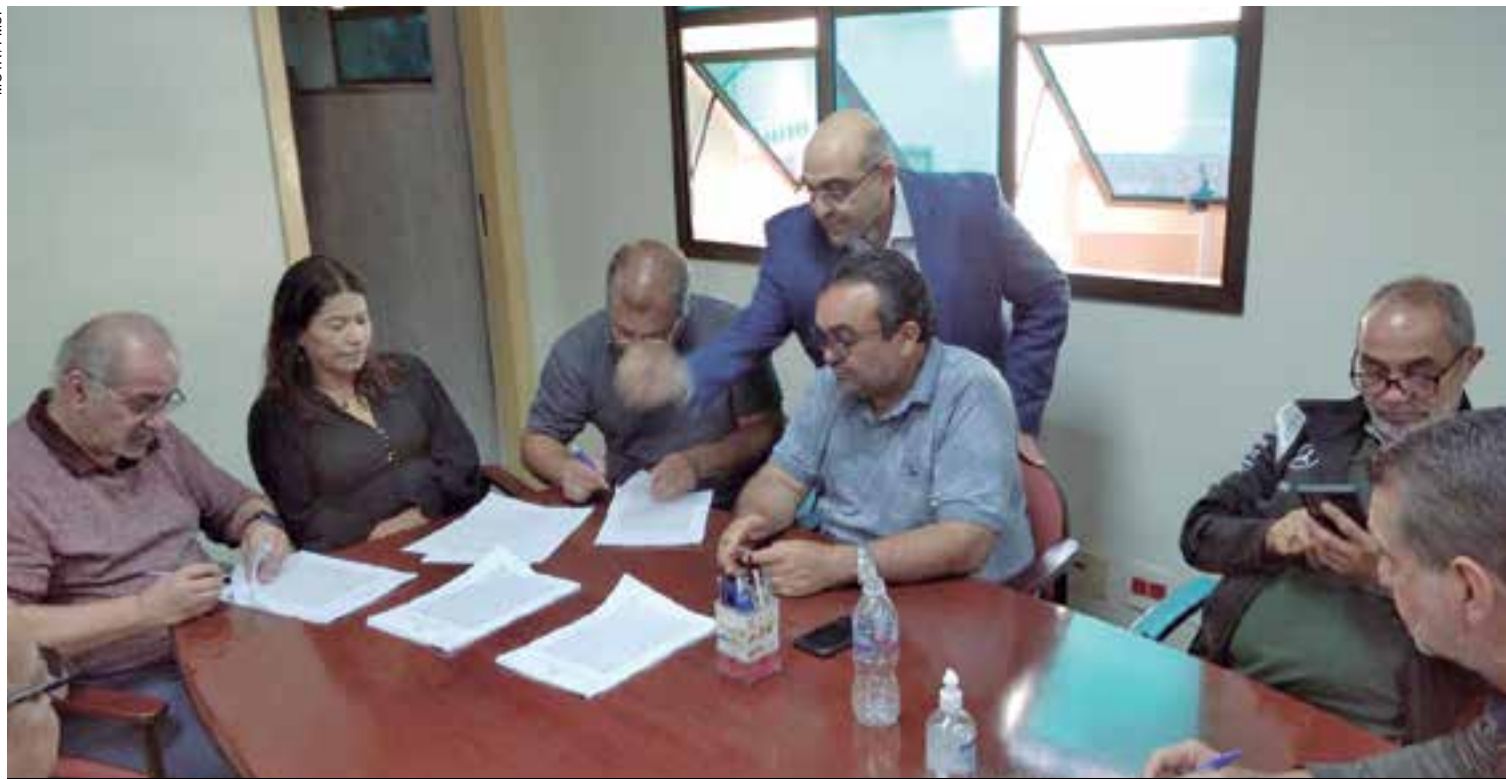
Dirigentes assinam Convenção Coletiva do setor de Fundição

Metalúrgicos e metalúrgicas que trabalham nos setores de Autopeças, Forjaria, Porcas e Parafusos (Grupo 3) e Fundição já estão com acordo da Campanha Salarial garantido. Além do reajuste, os trabalhadores e trabalhadoras destes segmentos conquistaram a manutenção da Convenção Coletiva e abono salarial. A negociação segue com os demais grupos, alguns deles devem fechar acordo nos próximos dias.