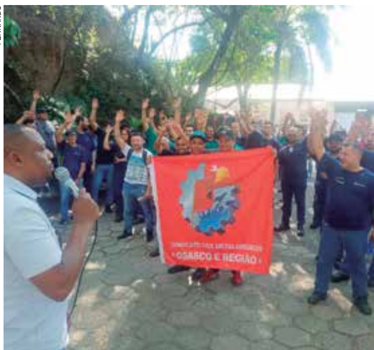
Proposta de PLR é aprovada na Engrecon

Veja o resumo dos acordos já fechados. P.3