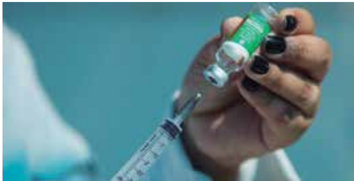
Vacina evita o agravamento da Covid-19

ISOLAMENTO - Em caso de suspeita de contaminação pelo vírus, é necessário fazer a testagem. Para aqueles que testarem positivo, o tempo de afastamento é em média de 5 dias, podendo chegar até 10 dias, caso se mantenham alguns dos sintomas.