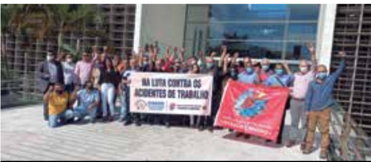
Sindicalistas denunciaram déficit de auditores na Alesp

acontece para resistirmos a ofensiva patronal sobre nossos direitos. O cenário é desafiador, e a categoria não pode abrir mão do reajuste e dos direitos da convenção coletiva. P.3