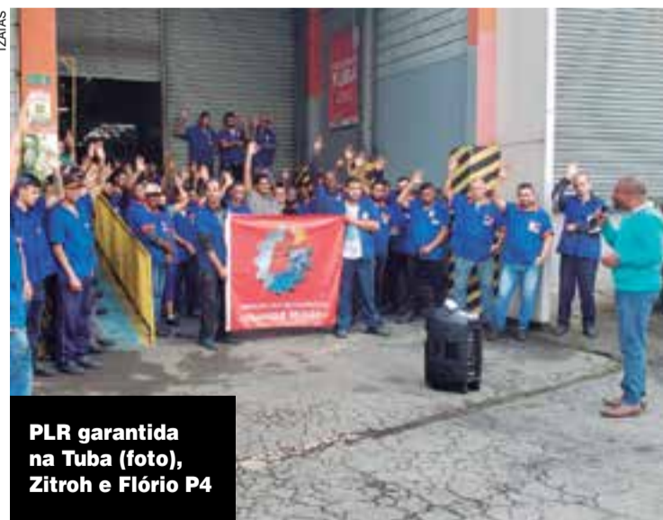
PLR garantida na Tuba (foto), Zitroh e Flório P4

Na quinta-feira, 9, Cissor e sindicatos da região vão se reunir com o Superintendente do Trabalho P.4