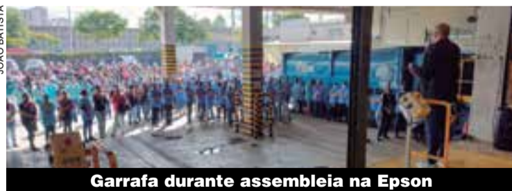
Garrafa durante assembleia na Epson