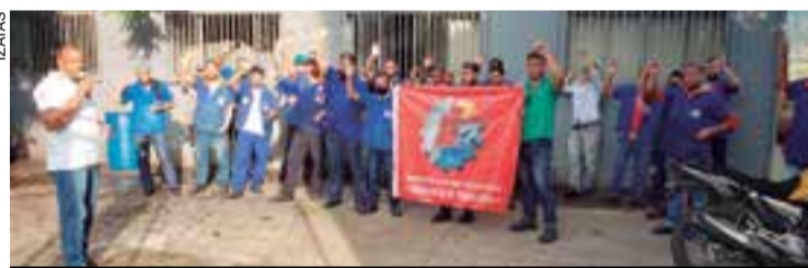
PLR aprovada pelos companheiros da Zitroh

vas rodadas de negociações serão retomadas em breve, junto da Comissão de PLR.