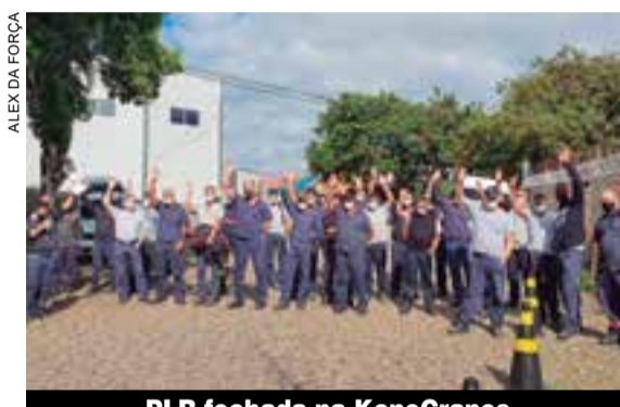
PLR fechada na KoneCranes