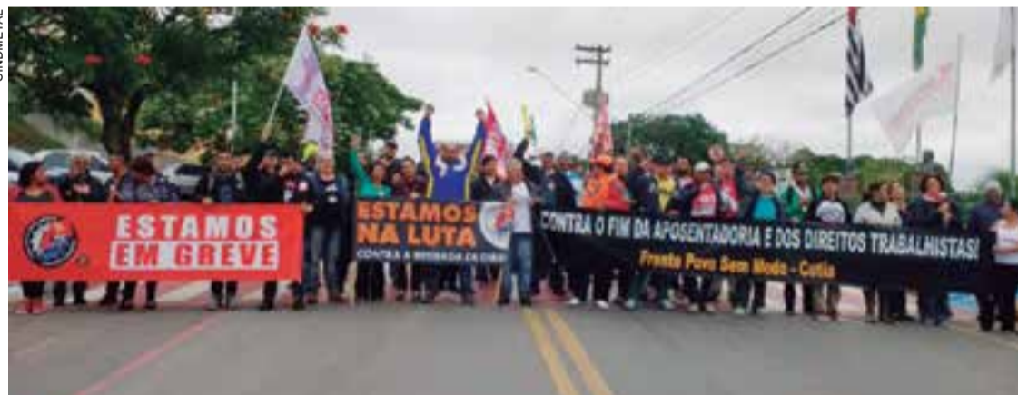
Em 2017, Sindicato tomou as ruas da região, como de Cotia, contra as reformas Trabalhista e da Previdência

A proposta de revogação da reforma trabalhista da Espanha é fruto de uma negociação complexa entre o governo, o empresariado e as entidades sindicais. Para Miguel Torres, presidente da força sindical, esse é um dos desafios que o Brasil enfrenta na tentativa de articulação para revogar a reforma trabalhista, já que, desde a posse, o governo Bolsonaro não mantém um diálogo aberto com os representantes da classe trabalhadora. [Com Agências de Notícias]