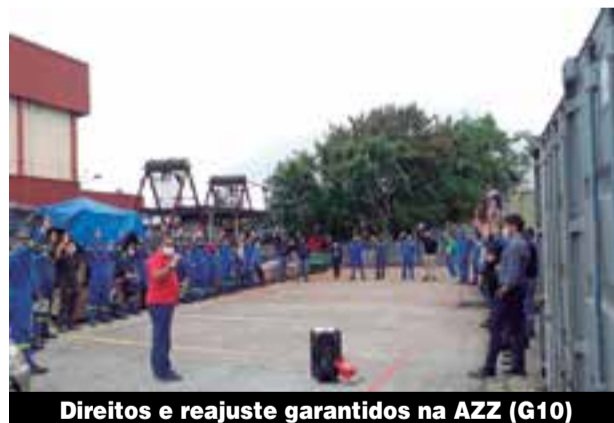
Direitos e reajuste garantidos na AZZ (G10)