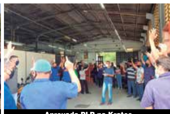
Aprovada PLR na Kratos