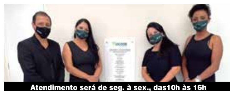
Atendimento será de seg. à sex., das 10h às 16h