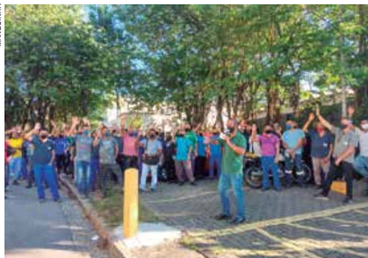
Reajuste e Convenção garantidos na Prodec (G10)

Na Neopró, os trabalhadores conseguiram resgatar a PLR de 2021. Já tem acordo de compensação também fechado na Semikron e na Mathis. P. 3