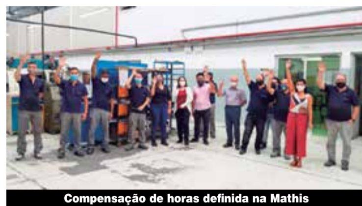
Compensação de horas definida na Mathis