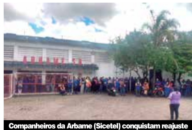
Companheiros da Arbame (Sicetel) conquistam reajuste

organizem e entrem em contato com o Sindicato, para juntos lutarmos por estes direitos”, destaca o diretor do Sindicato Sertório.