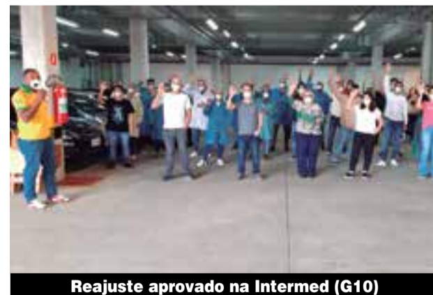
Reajuste aprovado na Intermed (G10)