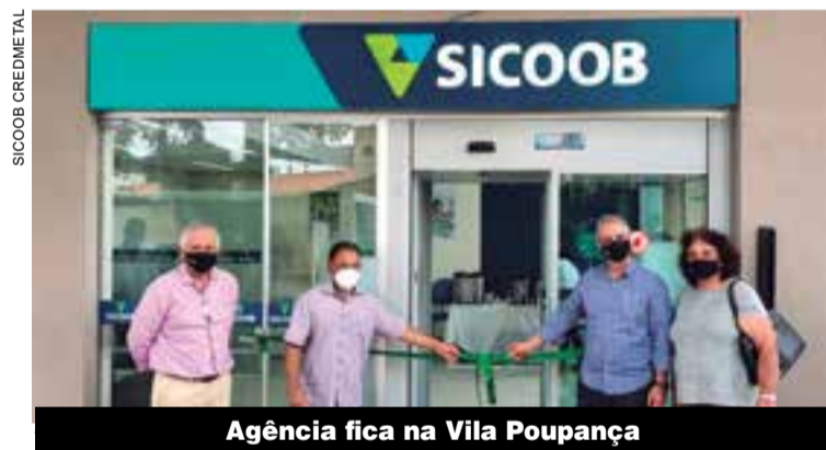
Agência fica na Vila Poupança

Espanha adota nova reforma trabalhista para rever a anterior. Mudanças podem inspirar o Brasil, as eleições 2022 serão decisivas para isso P.2 e 4