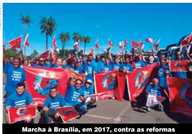
Marcha à Brasília, em 2017, contra as reformas

Companheiros da Prodec, Arbame, AZZ e Intermed saíram vitoriosos da negociação, estão com o reajuste e Convenção garantidos P.3