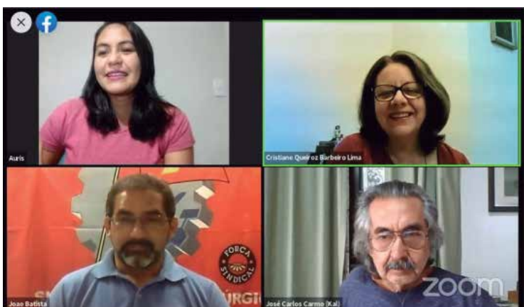
Pesquisadores defendem mapeamento da doença por setor

Protesto em frente à sede do BC, também pediu a desoneração da folha de pagamento para que empresas possam reagir aos efeitos da pandemia e manter empregos P.4