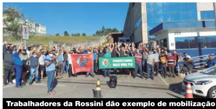
Trabalhadores da Rossini dão exemplo de mobilização