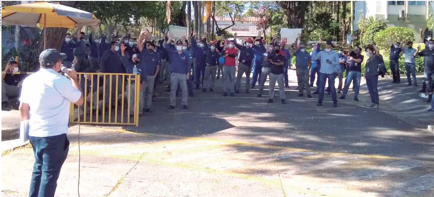
Capacidade de mobilização dos companheiros da Metalsa foi fundamental para o acordo de PLR