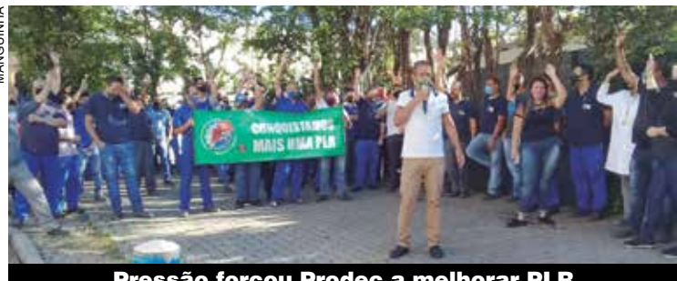
Pressão forçou Prodec a melhorar PLR

Para avaliar o resultado da mobilização, o diretor do Sindicato Sertório usou o grito de organização do grupo que foi criado pelos trabalhadores: “unidos seremos mais forte”. Com esta unidade, os trabalhadores e trabalhadoras, juntos do sindicato, conquistaram seus objetivos”