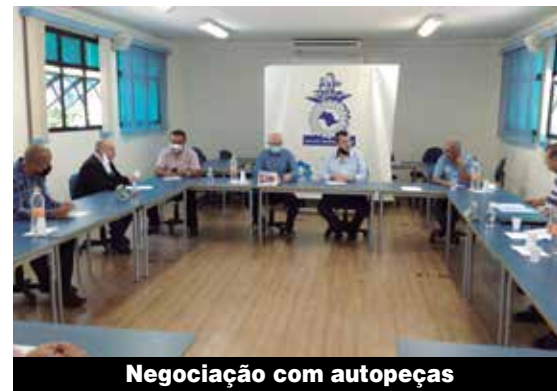
Negociação com autopeças