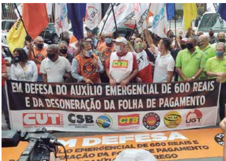
Centrais pressionam por auxílio de R$ 600,00

Disposição de luta vai determinar resultados das negociações P.3