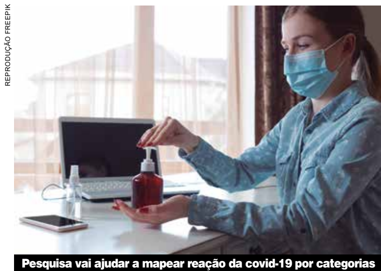
Pesquisa vai ajudar a mapear reação da covid-19 por categorias

Fora das piscinas, será obrigatório o uso de máscara e chinelo. Os vestiários estarão abertos só para trocas de roupas. Acesse o www.sindmetal.org.br e tenha acesso a todo o protocolo de segurança.