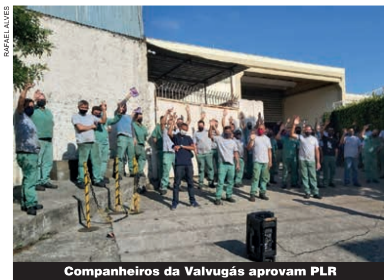
Companheiros da Vavugás aprovam PLR

Os metalúrgicos da Vavugás e da Jomer confiaram no Sindicato, na força da mobilização e na semana passada conquistaram PLR (Participação nos Lucros e Resultados). Na Vavugás, durante assembleia, o Sindicato também ressaltou a importância da Convenção Coletiva, que foi fundamental para evitar a contratação de mão-de-obra terceirizada na atividade fim.