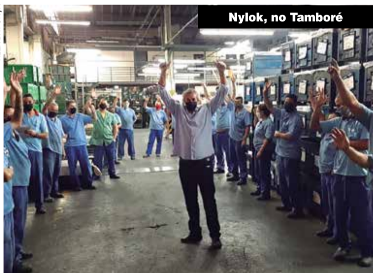
Nylok, no Tamboré