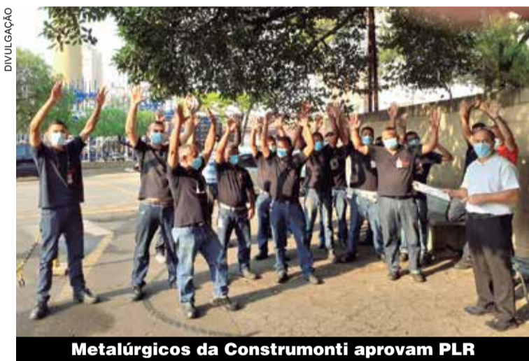
Metalúrgicos da Construmonti aprovam PLR

Para que a PLR não vire apenas ilusão dos metalúrgicos, a diretoria do Sindicato tem intensificado as negociações e cobrado as empresas que se negam a dialogar a respeito. O resultado desta atuação foi mais acordos fechados na última semana para os companheiros da Albrás, Alulev e Construmonti.