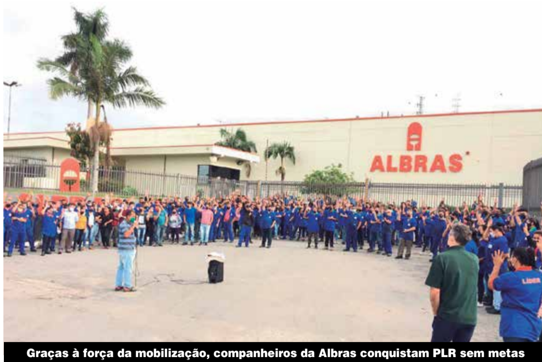
Graças à força da mobilização, companheiros da Albras conquistam PLR sem metas

A confiança dos trabalhadores no Sindicato fez a diferença e fortaleceu as negociações. As propostas foram apresentadas em assembleias e aprovadas pelos companheiros P.3