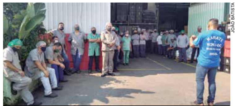
Na WR Ferramentaria, aprovada criação dos turnos 4X2

A produção aumentou e os trabalhadores da Jomer e da WR Ferramentaria aprovaram a criação de novos turnos. Na esteira desta expansão, cresce também as contratações.