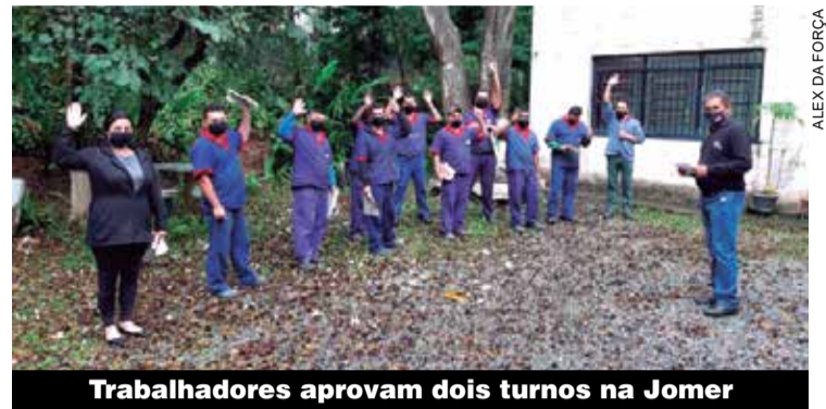
Trabalhadores aprovam dois turnos na Jomer