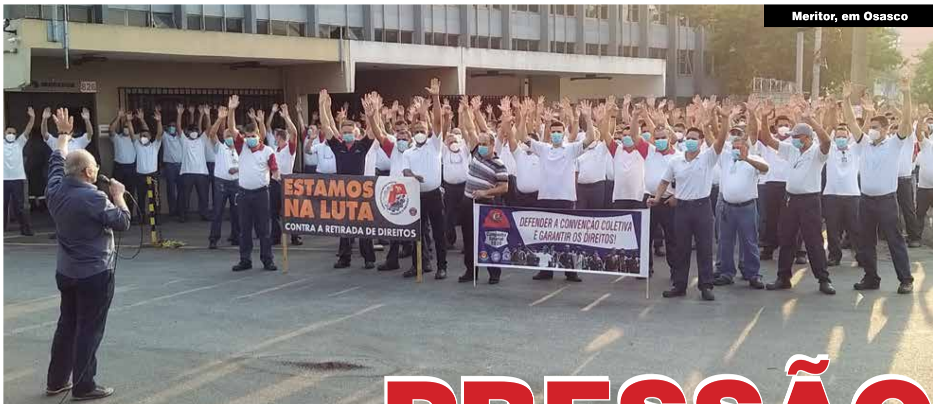
Meritor, em Osasco