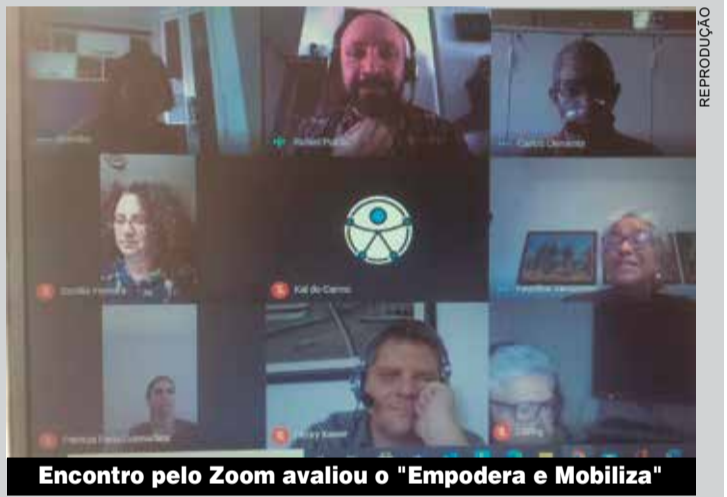
Encontro pelo Zoom avaliou o "Empodera e Mobiliza"

O destaque da reunião ficou por conta do retorno dos participantes sobre o "Empodera e Mobiliza". Cada um deles recebeu uma pesquisa de satisfação, e as respostas vão colaborar para a melhoria dos próximos eventos.