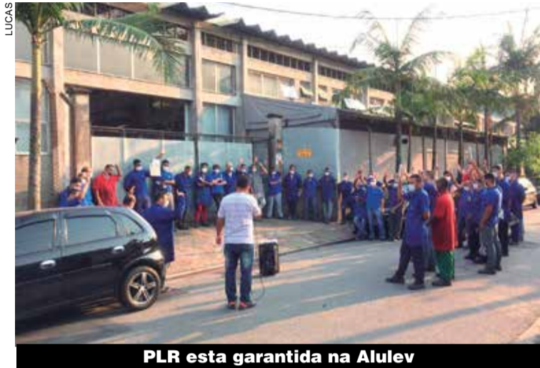
PLR esta garantida na Alulev