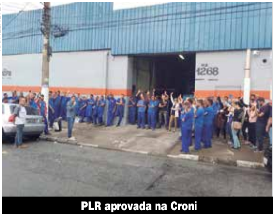
PLR aprovada na Croni