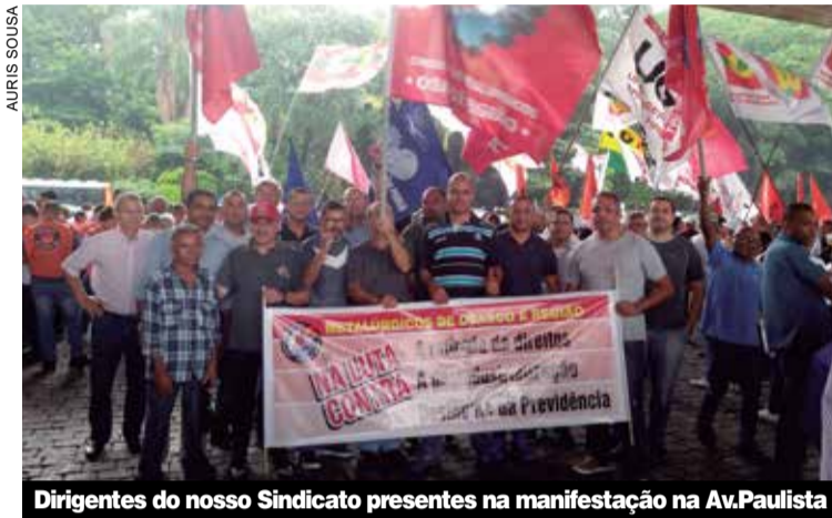
Dirigentes do nosso Sindicato presentes na manifestação na Av. Paulista

O ato é o primeiro organizado pelas centrais sindicais em 2020, em defesa do emprego, dos direitos dos trabalhadores e da indústria. Paulo Skaf, presidente da Fiesp (Federação das Indústrias do Estado de São Paulo) foi criticado pelos sindicalistas em decorrência do apoio que tem dado ao governo antitrabalhista de Jair Bolsonaro, que, inclusive, participou na segunda de um almoço na entidade.