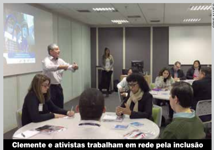
Clemente e ativistas trabalham em rede pela inclusão

O Espaço da Cidadania comemora seus 19 anos no próximo dia 10 com mais luta em defesa do direito das pessoas com deficiência ao trabalho. Desta vez, o ataque acontece por meio do projeto de lei 6159/19, de autoria do governo Bolsonaro, que busca flexibilizar a Lei de Cotas. Para definir ações de resistência, vamos ter um debate na sede, das 9h às 11h.