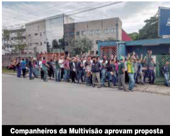
Companheiros da Multivisão aprovam proposta

A persistência e a organização dos metalúrgicos de Osasco e região junto ao Sindicato continuam em avanços da conquista da PLR (Participação nos Lucros ou Resultados). Na quinta-feira, 30, os companheiros da Andritz conquistaram acordo de PLR em que o valor mínimo pago será de R$ 5.600.