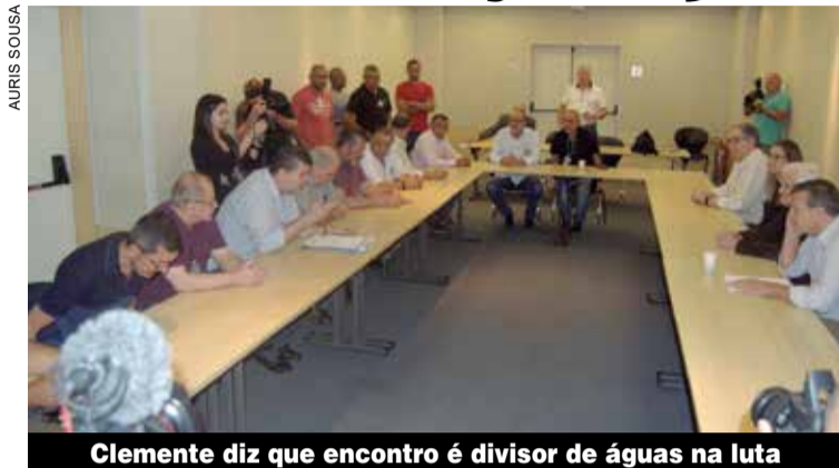
Clemente diz que encontro é divisor de águas na luta

A pauta de reivindicações dos metalúrgicos deste ano é de resistência e condiz com a palavra de ordem “Na Convenção Ninguém Bota a Mão”. O documento entregue aos patrões defende os direitos históricos já conquistados pela categoria, que estão sob forte ameaça desde a última campanha, em virtude da aprovação da reforma trabalhista. Outra