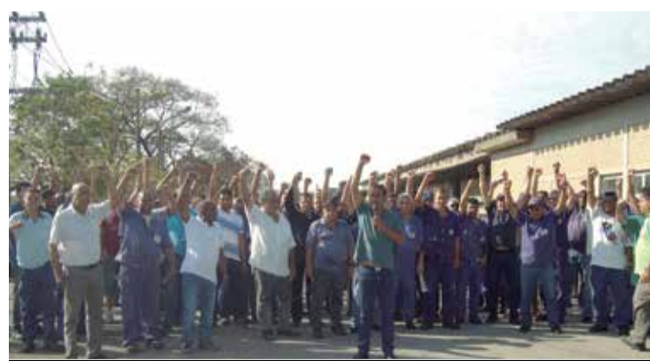
Metalúrgicos da Rayton estão de prontidão para cobrar acordo

ção necessária, buscou alternativas para unificar todos os trabalhadores. Tem nos representado e orientado bem”, avaliou.