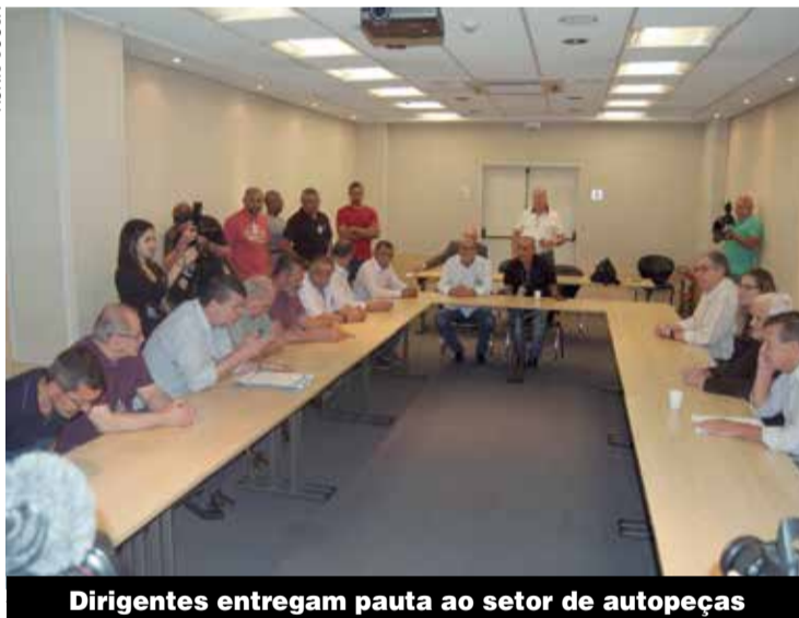
Dirigentes entregam pauta ao setor de autopeças