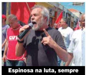
Espinosa na luta, sempre

Tenha acesso a íntegra da nota pelo www.sindmetal.org.br