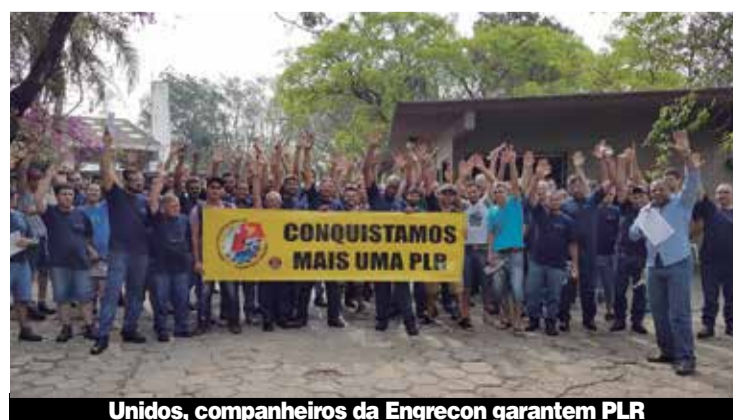
Unidos, companheiros da Engrecon garantem PLR