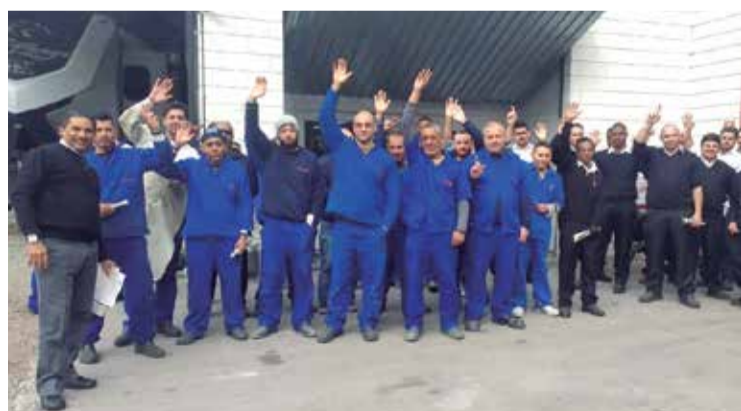
Com pressão, trabalhadores da JL garantem PLR P.3