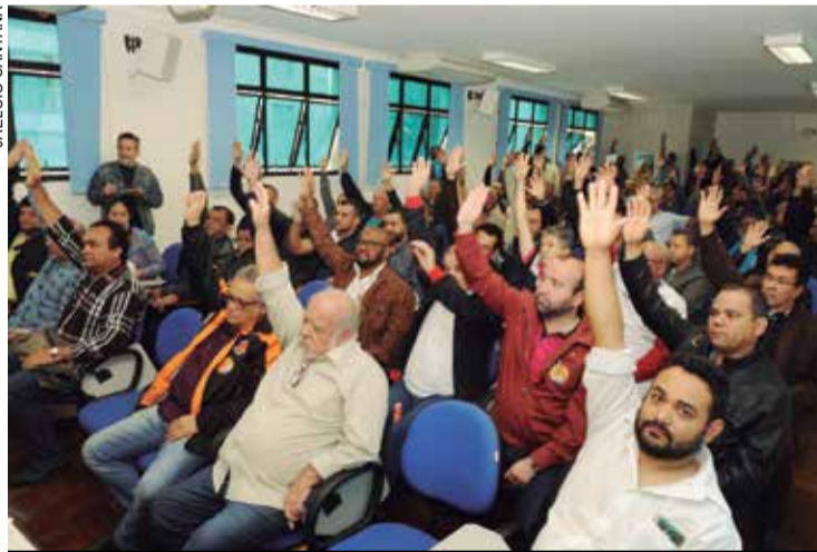
Lideranças da Federação unidas por direitos