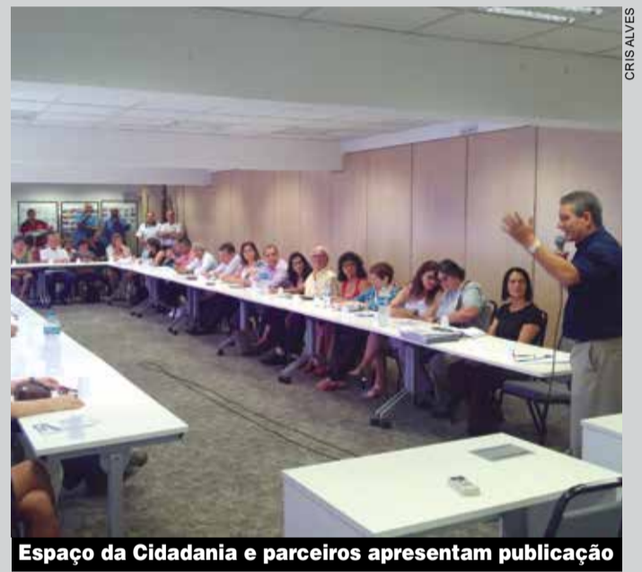
Espaço da Cidadania e parceiros apresentam publicação

O debate sobre a inclusão também vai ganhar força com os exemplos de contratação de pessoas com deficiências na base e com informações do Ministério do Trabalho sobre fiscalização e cumprimento da Lei de Cotas.