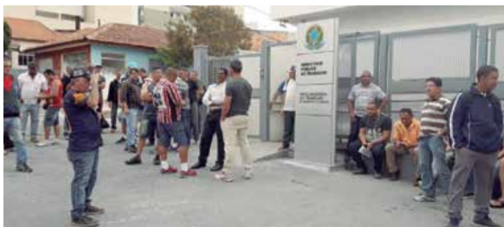
Sindicato foi com trabalhadores ao MPT buscar solução

mais uma vez para audiência de conciliação no Ministério Público do Trabalho, em Barueri, que até o fechamento desta edição não tinha sido concluída.