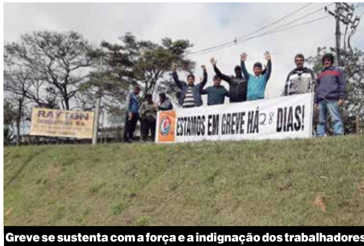
Greve se sustenta com a força e a indignação dos trabalhadores

Na última rodada, destaque foi a equipe da Ctrons. P.4