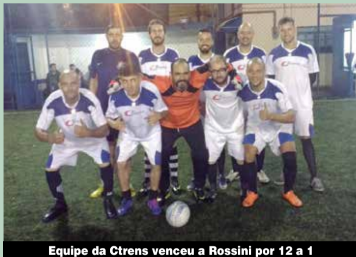
Equipe da Ctrens venceu a Rossini por 12 a 1