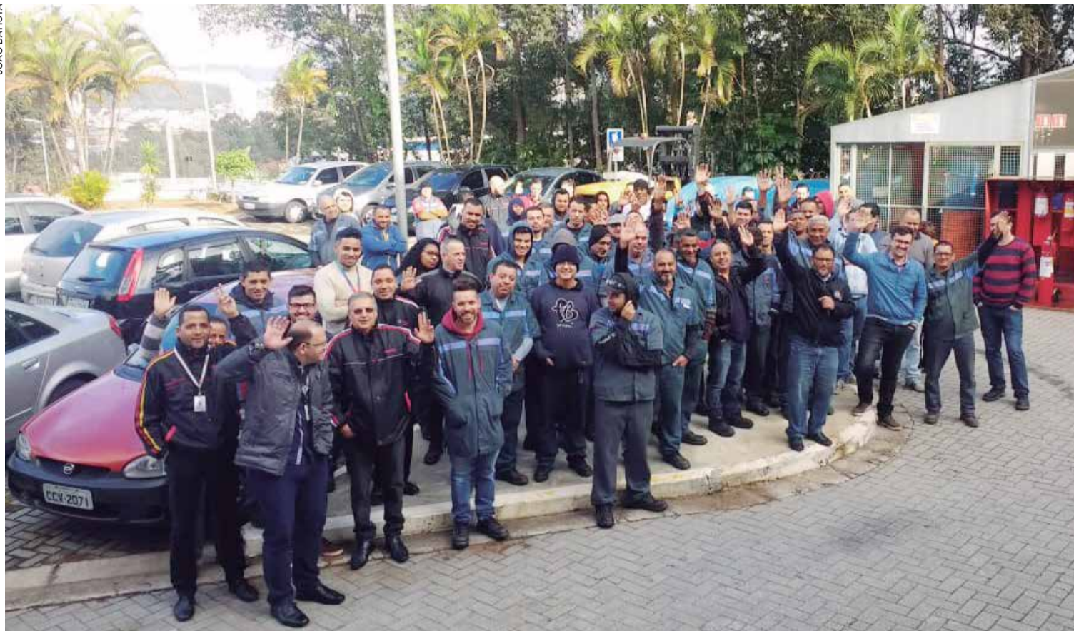
Companheiros da Robert Bosch defendem a Convenção Coletiva, cujos direitos são melhores que a lei

A mobilização em defesa da Convenção Coletiva ganha ainda mais força nesta quarta-feira e quinta-feira, com a participação dos metalúrgicos de Cotia, Vargem Grande Paulista, Barueri, Santana de Parnaíba e Pirapora do Bom Jesus, com a série de manifestações organizada pelo Sindicato. Os protestos recomeçaram na última semana, mobilizando companheiros de Alphaville, Carapicuíba, Tamboré, Jandira e Itapevi.