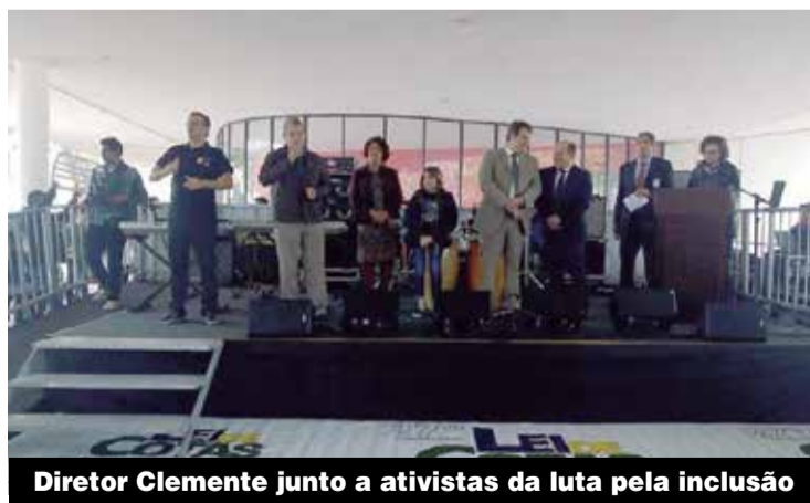
Diretor Clemente junto a ativistas da luta pela inclusão

os resultados e programe-se para os jogos. P.4