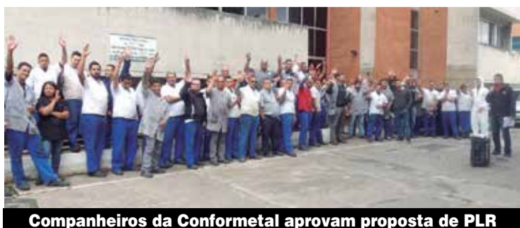
Companheiros da Conformetal aprovam proposta de PLR

Os companheiros da Conformetal, de Osasco, e da Conduferes, de Cotia, iniciam a semana com a certeza de que irão contar com a PLR. Organizados pelo Sindicato, eles fecharam o acordo, que distribui lucros e dá uma bela força ao bolso do trabalhador, além de aquecer a economia regional.