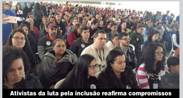
Ativistas da luta pela inclusão reafirma compromissos