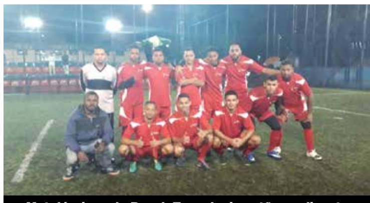
Metalúrgicos da Bosch Tecnologia estão na disputa

Metalúrgicos de Osasco e da região de Taboão da Serra se reúnem no Sindicato para fortalecer a resistência contra pressão patronal sobre direitos. P.3