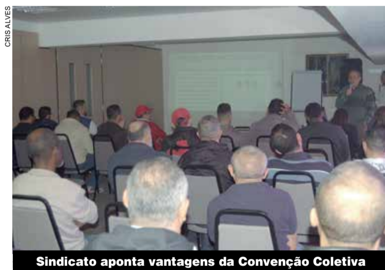
Sindicato aponta vantagens da Convenção Coletiva