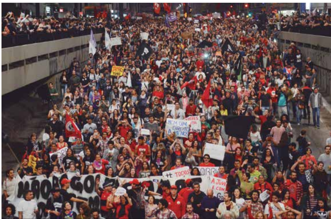
Manifestação em 2016 contra o golpe já denunciava o que viria por aí: retrocesso

Uma situação insuportável, que exige que pressionemos o governo, os empresários e também os candidatos nestas eleições para que hajam atitudes para freá-la.