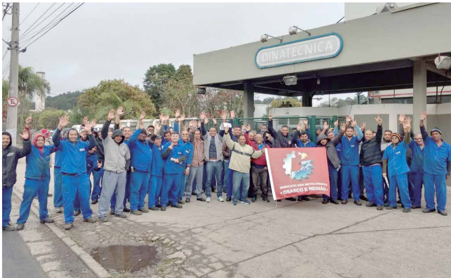
Junto com o Sindicato, companheiros da Dinatecnica fortalecem a resistência em defesa da Convenção Coletiva