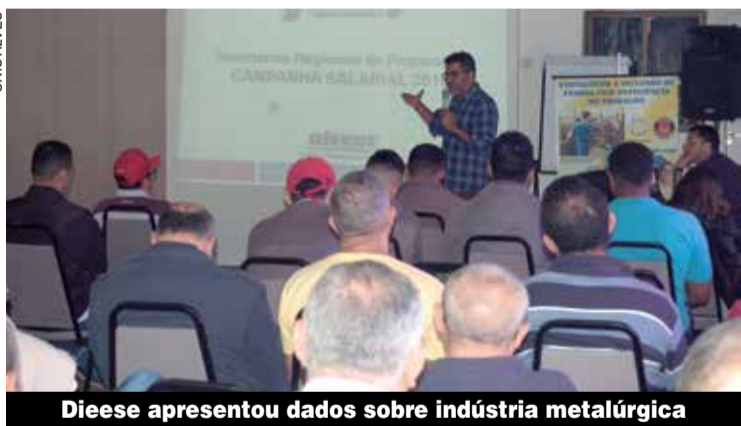
Dieese apresentou dados sobre indústria metalúrgica

“Ficou bem claro o momento que passa o país e a categoria. Foi bem passado o momento de opressão que estamos vivendo em que o capital quer tirar tudo do trabalhador” companheiro aposentado