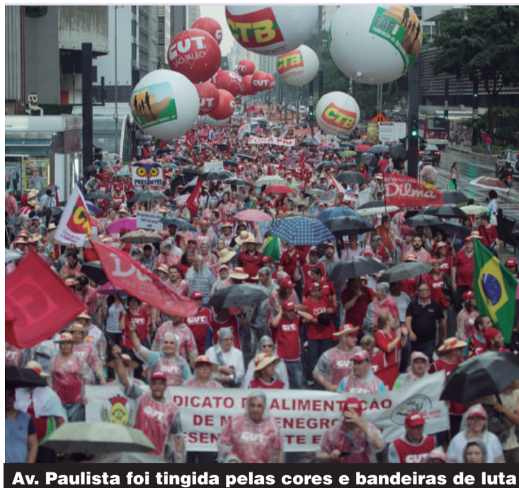
Av. Paulista foi tingida pelas cores e bandeiras de luta

Na passeata de sexta-feira, 13, os trabalhadores tomaram a Av. Paulista para defender a democracia e a valorização da Petrobras, além de cobrar a realização da reforma política e a retirada das MPs que mexem em direitos. Trabalhadores não aceitam tese de impeachment. P.2 e 3.