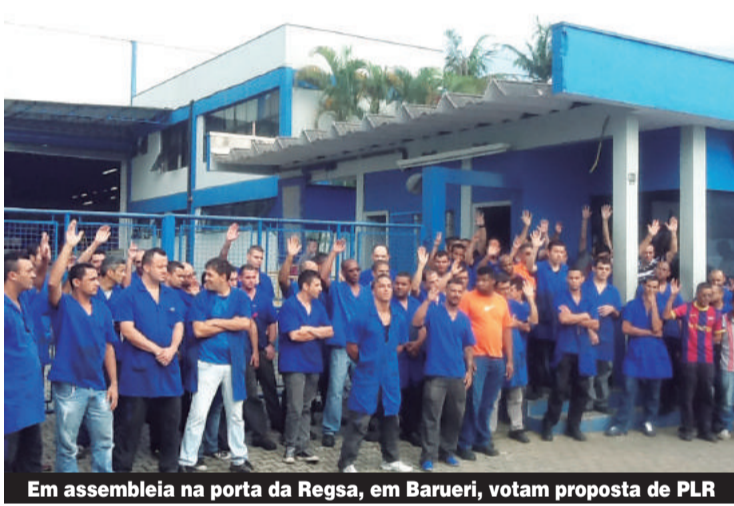
Em assembleia na porta da Regsa, em Barueri, votam proposta de PLR