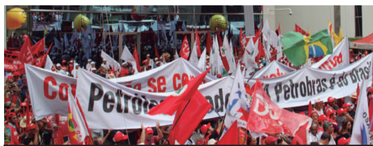
Trabalhadores estão na linha de frente contra ataques

O pré-sal é explorado pelo modelo de partilha de produção. Com isso, a Petrobras opera com participação mínima de 30% em todos os poços do pré-sal e é detentora do óleo no subsolo. No caso das empresas privadas, se elas identificarem poços viáveis, recebem em óleo o equivalente pelas despesas que teve para encontrar o poço e também os volumes de produção correspondentes aos