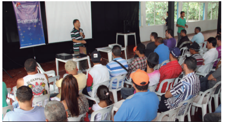
Delegados, cipeiros e coletivos opinaram sobre ações do Sindicato

Dúvidas: cristiane.imprensa@sindmetal.org.br