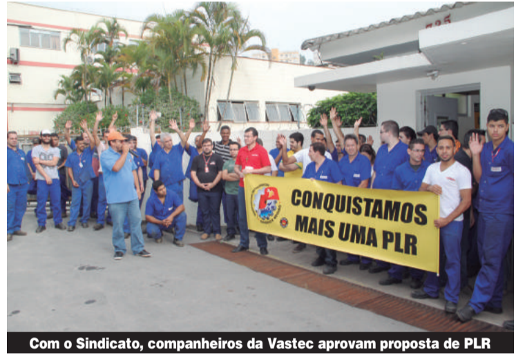
Com o Sindicato, companheiros da Vastec aprovam proposta de PLR