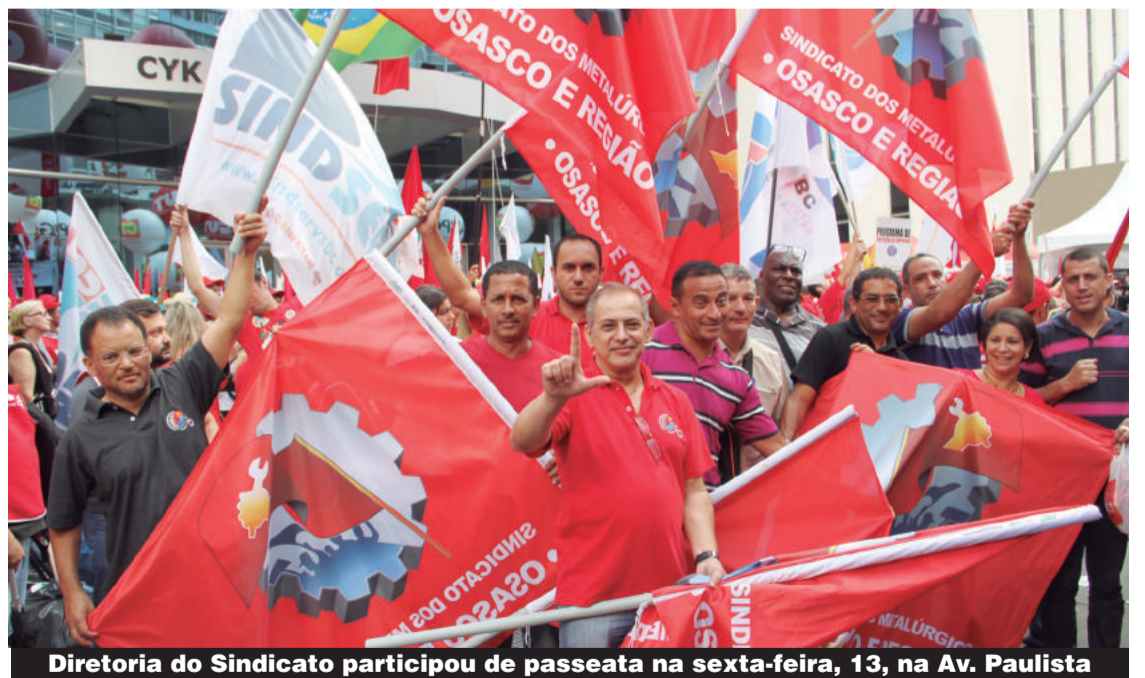
Diretoria do Sindicato participou de passeata na sexta-feira, 13, na Av. Paulista

A massa de trabalhadores também repudiou os ataques a Petrobras, que se misturam a necessidade de punição daqueles que forem comprovadamente envolvidos nas denúncias de corrupção. “Tem de punir, tem de punir, mas a Petrobras é um patrimônio nacional”, defendeu um dos manifestantes. [Mais na p.4]