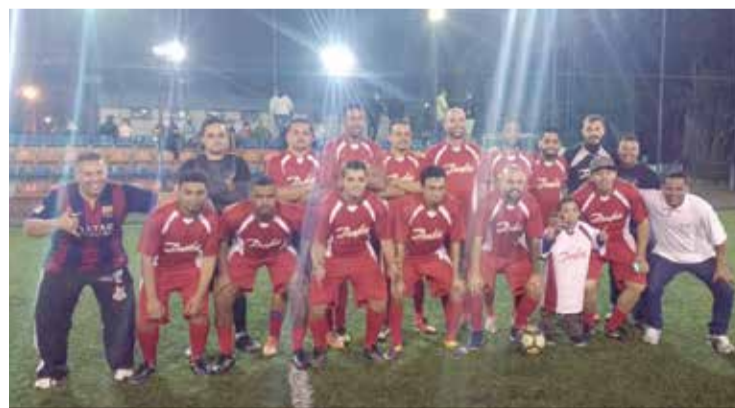
Time da Donfoss se deu bem na estréia no Campeonato