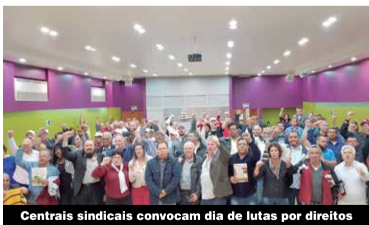
Centrais sindicais convocam dia de lutas por direitos

goria, que são melhores que os previstos em lei. Este foi o alerta dado no último sábado, no seminário que reuniu metalúrgicos das regiões de Jandira e Carapicuíba. P.3