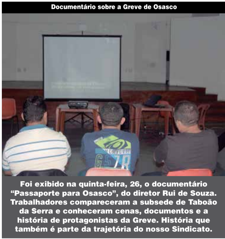
Foi exibido na quinta-feira, 26, o documentário “Passaporte para Osasco”, do diretor Rui de Souza. Trabalhadores compareceram a subsede de Taboão da Serra e conheceram cenas, documentos e a história de protagonistas da Greve. História que também é parte da trajetória do nosso Sindicato.