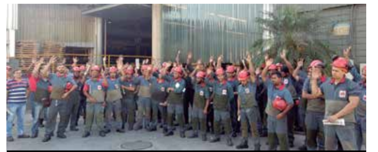
Trabalhadores da Monteferro aprovam proposta de PLR