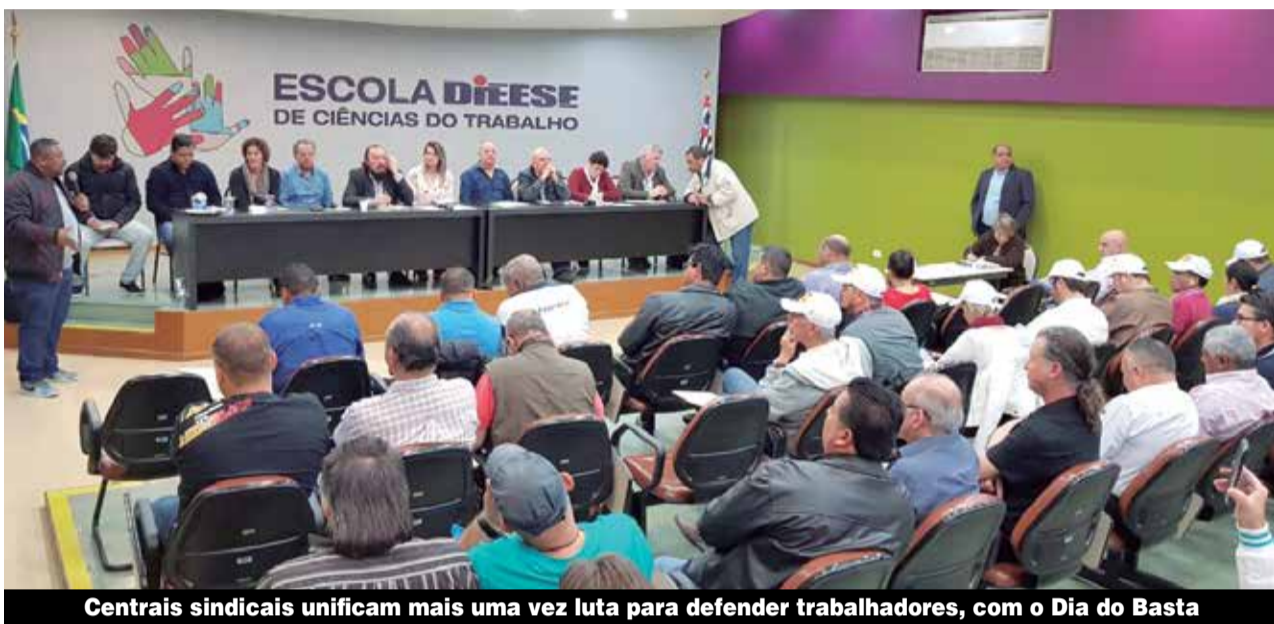
Centrais sindicais unificam mais uma vez luta para defender trabalhadores, com o Dia do Basta

mas os poucos empregos que vêm sendo criados são precários, com contrato temporário ou intermitente. É na luta que vamos virar esse jogo.