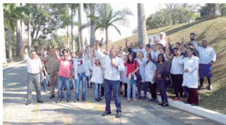
Trabalhadores da Semikron mobilizados para a luta

10 um Dia Nacional de Luta para dizer basta ao desemprego e a precarização de direitos. P.4