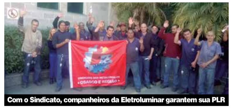
Com o Sindicato, companheiros da Eletrolumina garantem sua PLR

A PLR é um direito que para ser respeitado precisa da cobrança e da pressão dos trabalhadores, junto ao Sindicato. Se você ainda não tem, organize os companheiros e venha para a luta!