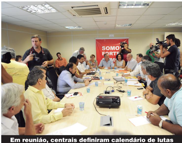
Em reunião, centrais definiram calendário de lutas

LUTA – As mudanças entram em vigor em março, mas os trabalhadores estão dispostos a impedi-las. Por isso, vamos para as ruas cobrar a manutenção dos direitos. Numa reunião na terça-feira, 13, as centrais definiram que 28 de janeiro, é Dia Nacional de Luta em Defesa dos Empregos, com assembleias, passeatas e paralisações, no início da manhã e manifestação unificada no vão livre do Masp, na Av. Paulista, a partir das 10h. E no dia 26 de fevereiro, acontece a Marcha da Classe Trabalhadora.