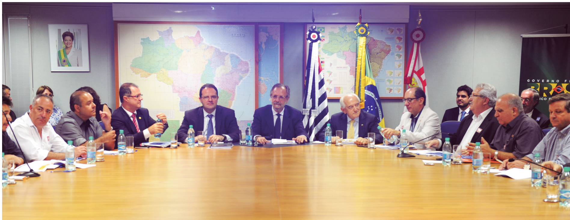
Dirigentes das centrais sindicais cobram de ministros a revogação de Medidas Provisórias que retiram direitos dos trabalhadores

O governo não está disposto a revogar as Medidas Provisórias que instituem as mudanças no seguro