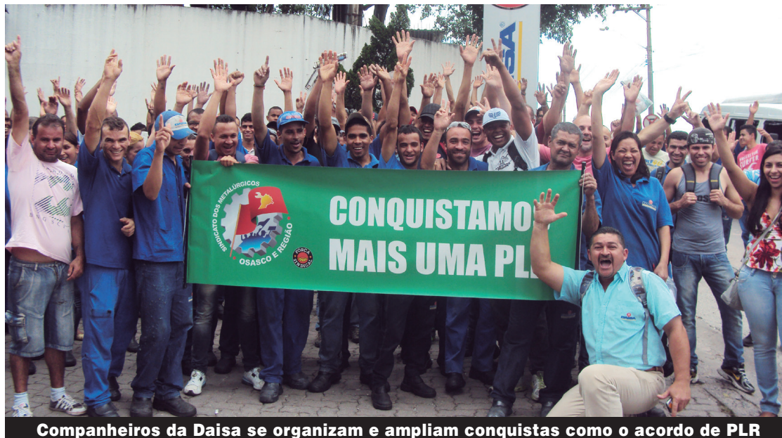
Companheiros da Daisa se organizam e ampliam conquistas como o acordo de PLR

O ano começa com o pagamento da PLR, na Daisa, uma conquista que se soma a uma série acumulada nos últimos meses, graças a organização dos trabalhadores com o Sindicato. P.3.