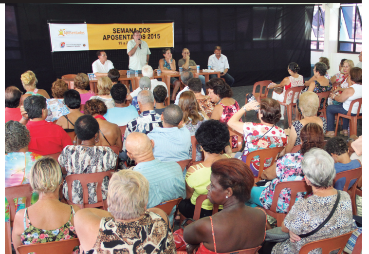
Dezenas de aposentados se informam em palestras no Sindicato