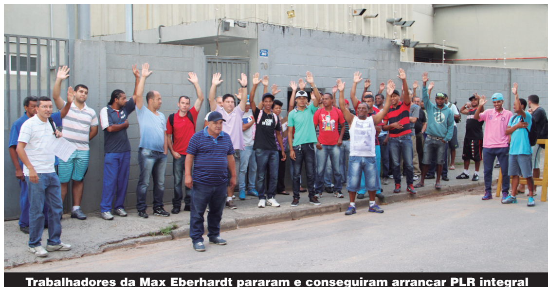
Trabalhadores da Max Eberhardt pararam e conseguiram arrancar PLR integral

Os companheiros da Wap e da Irrigabras não deixaram o ano de 2014 terminar sem antes concluírem as negociações de PLR válidas para 2014/2015. Na Irrigabras, a PLR pode chegar a R$ 6.270.