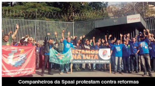
Companheiros da Spaal protestam contra reformas

vado ao final da reunião da CCJ (Comissão de Constituição e Justiça) que, na quarta-feira, 28, votou o parecer de Romero Jucá (PMDB-RR) para o projeto de lei. Jucá recomendou a aprovação do projeto do jeito que está, propondo que algumas das principais mudanças solicitadas pelos senadores entrassem em medida provisória, a ser editada pelo governo Temer. Por 16 votos a 9, o projeto foi aprovado na comissão.