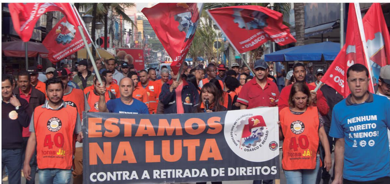
Metalúrgicos chegam ao calçadão de Osasco, em protesto que também reuniu outras categorias em dia de pressão contra as reformas trabalhista e da Previdência