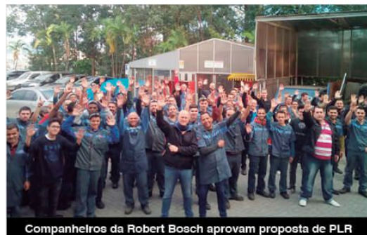
Companheiros da Robert Bosch aprovam proposta de PLR

Reforma pode mudar acordo de banco de horas P.3