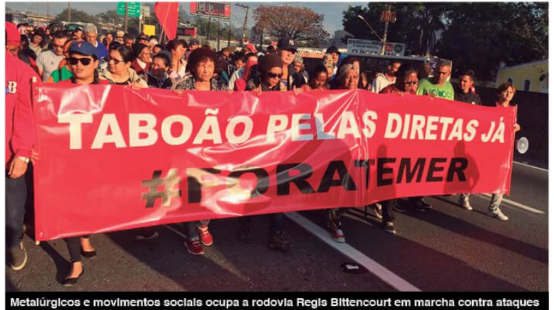
Metalúrgicos e movimentos sociais ocupa a rodovia Regis Bittencourt em marcha contra ataques

Em São Paulo, as centrais realizaram um ato em frente a Superintendência Regional do Trabalho. O dia terminou com uma grande manifestação, organizada pela Frente Brasil Popular, que saiu da Av. Paulista até a Praça Roosevelt, no centro da cidade.