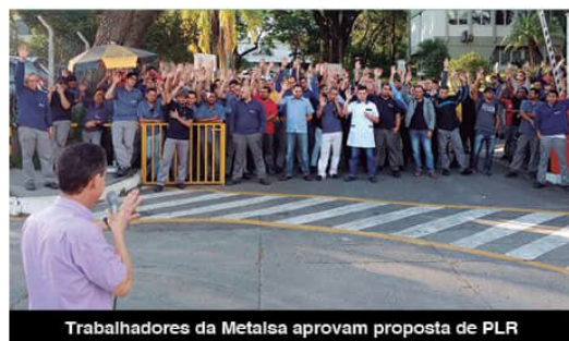
Trabalhadores da Metalsa aprovam proposta de PLR

A batalha por PLR (Participação nos Lucros e Resultados) tem se mantido firme na região de Osasco. Prova disso é que a cada semana mais metalúrgicos conquistam a tão desejada divisão nos lucros. Os companheiros da Metalsa, em Osasco, e da Robert Bosch, em Alphaville, foram os últimos a comemorar o avanço de mais um acordo.