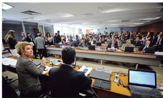
Votação na CAS foi a primeira vitória da pressão contra reformas

A discussão ainda precisa acontecer na CCJ (Comissão de Constituição e Justiça) para, então, ir para votação no plenário do Senado, que deverá avaliar tanto a decisão da CCJ, quanto os textos de Ferraço, de Paim e o projeto de lei encaminhado pelo governo Temer. Na CCJ, o relatório em análise é do senador Romero Jucá (PMDB-RR) que é fiel aliado de Temer e defende a reforma. A votação está prevista para esta quarta-feira, 28.