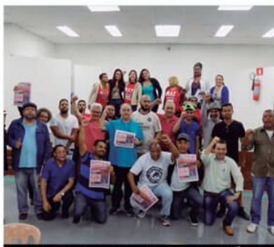
Em Taboão, movimentos fazem atos unificados

MANDE FOTOS E RELATOS DOS PROTESTOS NA SUA FÁBRICA/CIDADE PARA O NOSSO WHATSAPP: (11) 9-6078-0209