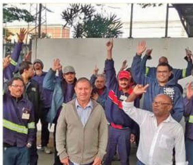
Trabalhadores da Magno aprovam proposta