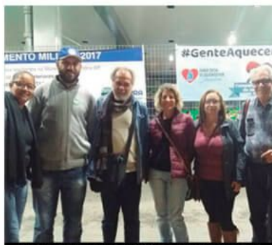
Em Jandira, "esquentar" reuniu lideranças