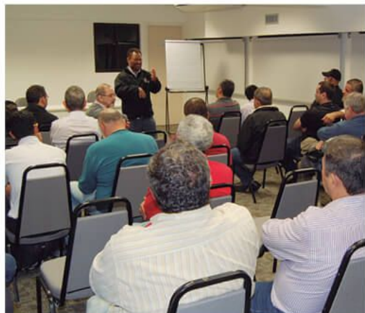
Assembleia aprovou participação nos protestos

posta de reforma trabalhista de indecente e irresponsável. "Eu diria que [a reforma] é um monstro que eles [governo Temer] construíram com 117 artigos alterando a CLT, [isso] é inaceitável", explicou Paim, que apresentou na sexta-feira, 23, a CCJ um voto pela inconstitucionalidade da reforma trabalhista.