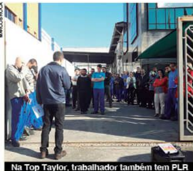
Na Top Taylor, trabalhador também tem PLR