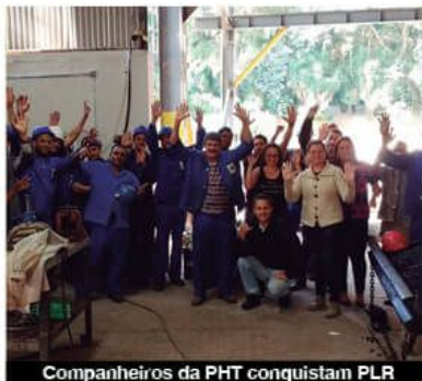
Companheiros da PHT conquistam PLR