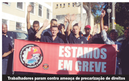
Trabalhadores param contra ameaça de precarização de direitos