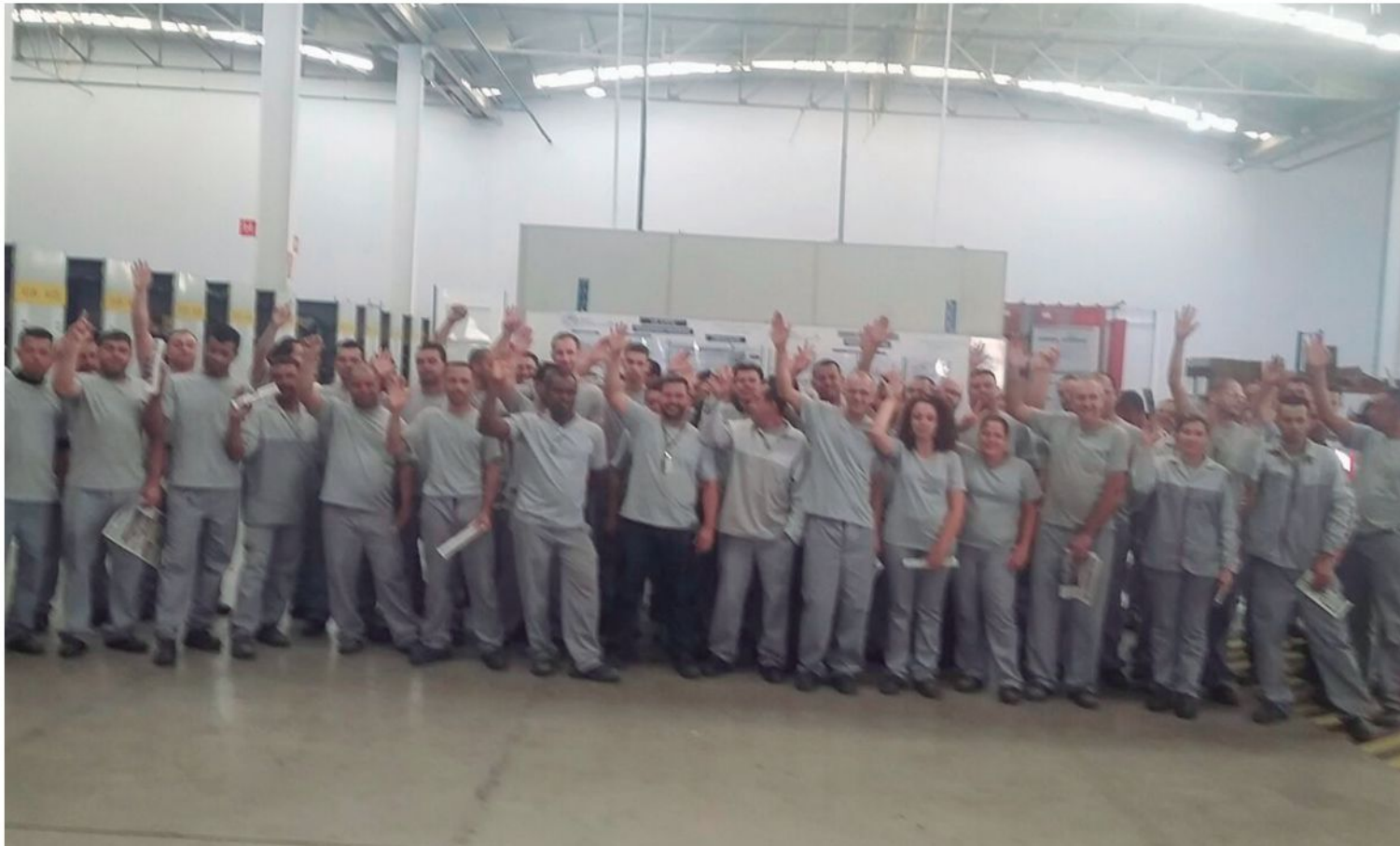
Junto com o Sindicato, trabalhadores da Peugeot, de Barueri, conquistam um dos maiores acordos de PLR da região

Com luta e organização junto com o Sindicato, os metalúrgicos da região vencem a choradeira patronal e conquistam acordos de PLR (Participação nos Lucros ou Resultados). Foi o que aconteceu em empresas como a Peugeot, Jas, Eletroluminar, Stillux, entre outras, na última semana. Participação e pressão dos trabalhadores é fundamental. Acompanhe o resultado das lutas na região e se organize com os seus companheiros para lutar por seus direitos. O Sindicato está junto com os metalúrgicos em todas as lutas. P.3