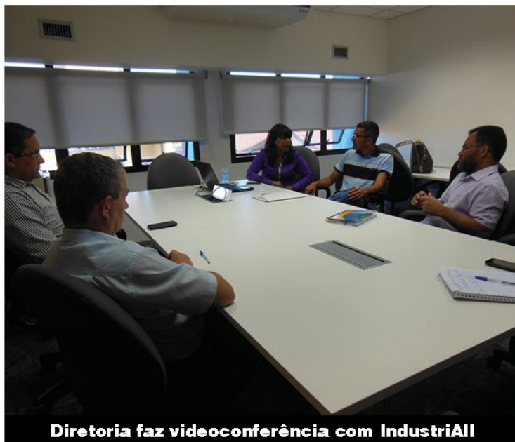
Diretoria faz videoconferência com IndustriAll

Ligue para a nossa linha direta (11) 3651-7212 ou mande e-mail para contepragente@sindmetal.org.br Não precisa se identificar