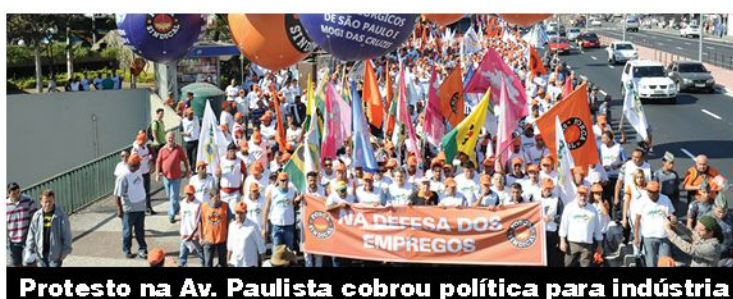
Protesto na Av. Paulista cobrou política para indústria

Contra violência, participação social P.2