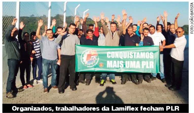
Organizados, trabalhadores da Lamiflex fecham PLR

Um dos resultados da pressão já apareceu na segunda-feira, 17. A comissão de trabalhadores teve uma