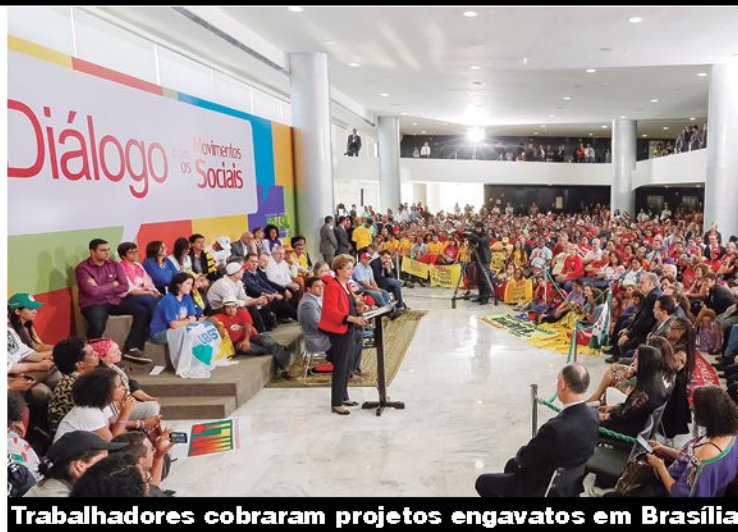
Trabalhadores cobraram projetos engavatos em Brasília