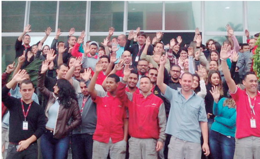
Organizados com o Sindicato, metalúrgicos da Kion ampliam lista dos trabalhadores que conquistam PLR