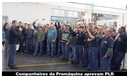
Companheiros da Promáquina aprovam PLR