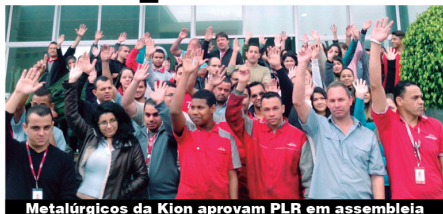
Metalúrgicos da Kion aprovam PLR em assembleia

Na semana passada foi a vez dos companheiros da Kion South América, em Alphaville, comemorarem a conquista de mais uma PLR (Participação nos Lucros e Resultados). O acordo foi aprovado durante assembleia.