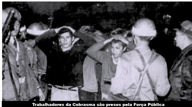
Trabalhadores da Cobrasma são presos pela Força Pública