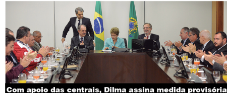
Com apoio das centrais, Dilma assina medida provisória

Um comitê formado por diversos ministérios, como o da Fazenda e o do Trabalho, irá definir os critérios para um setor ser contemplado pelo PPE. Tais detalhes devem ser