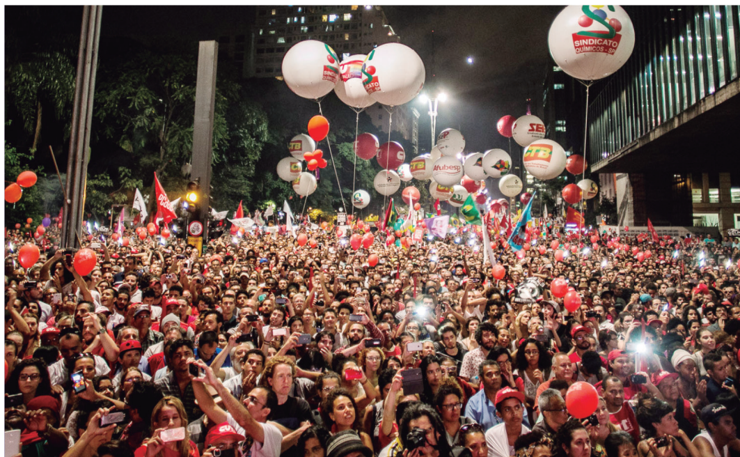
500 mil manifestantes vão a Av. Paulista, na sexta-feira, 18, para exigir respeito à Democracia e a direitos sociais

A Democracia e os direitos dos trabalhadores são os principais alvos da disputa de poder que está em curso no país. Por trás do discurso de combate à corrupção a qualquer preço estão os interesses das elites nacionais, que sustentam os 55 projetos que atacam nossos direitos no Congresso Nacional e que nunca concordaram com projetos como o Bolsa Família e a política nacional de valorização do salário mínimo.