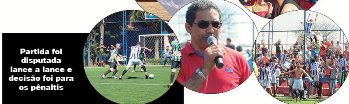
Partida foi disputada lance a lance e decisão foi para os pênaltis