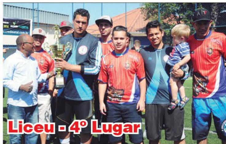
Liceu - 4º Lugar