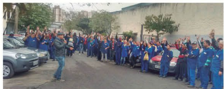
Companheiros da Carmona também estão com a PLR garantida