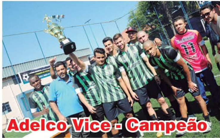
Adelco Vice - Campeão