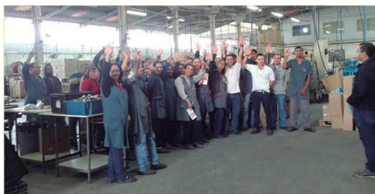
Metalúrgicos da Gram Serv e Gram Tampa aprovam proposta