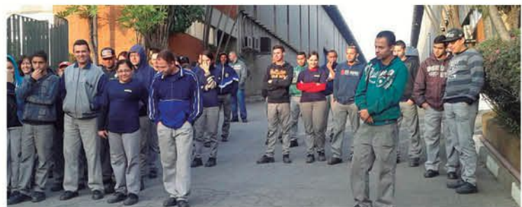
Trabalhadores da Alka 3 também aprovam o acordo do PLR