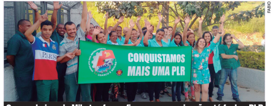
Companheiros da Mikatos foram firmes na organização até fechar PLR