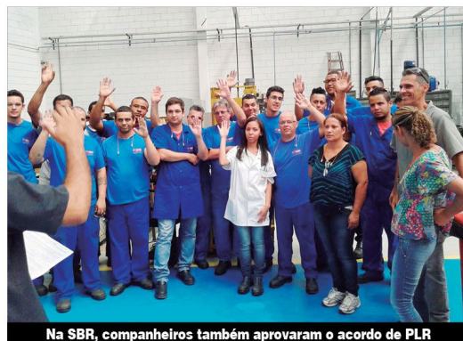
Na SBR, companheiros também aprovaram o acordo de PLR

JANDIRA – Os trabalhadores da Eirich não desistiram e resgataram a PLR de 2015.