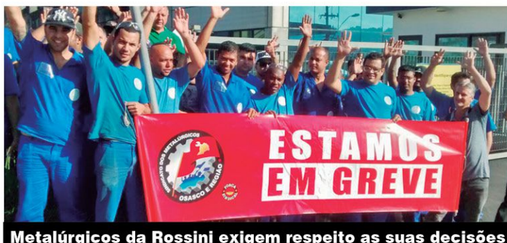
Metalúrgicos da Rossini exigem respeito as suas decisões