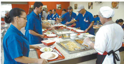
A cada 6h ou mais de jornada, o intervalo tem de ser de 1h

Dúvidas: cristiane.imprensa@sindmetal.org.br