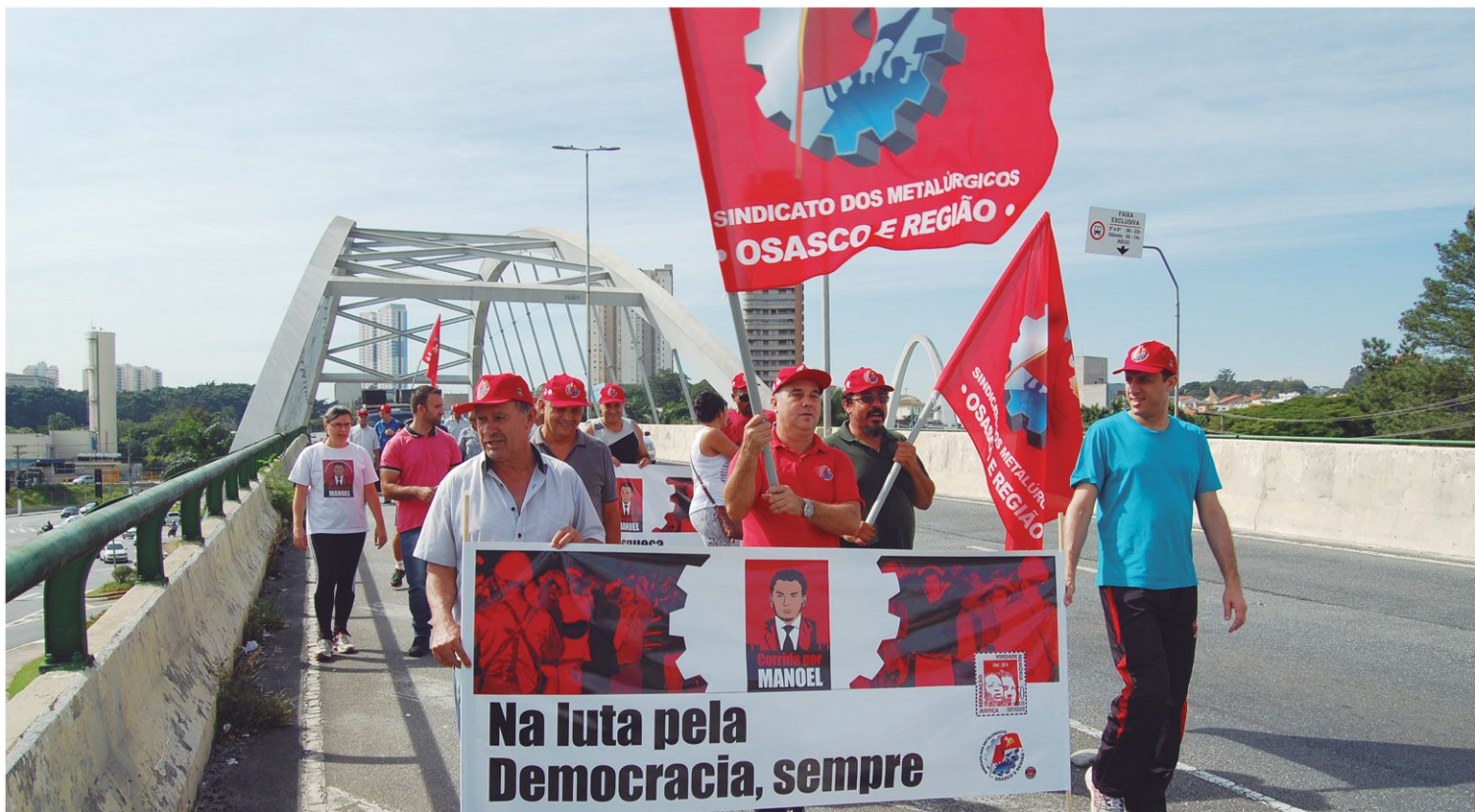
Diretores e assessores do nosso Sindicato caminharam ao lado de lideranças de 68 pelas ruas de Osasco