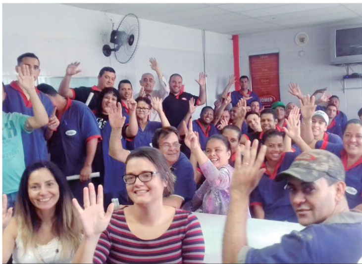
Companheiros da Jomer aprovam acordo de PLR