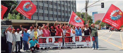
Em frente a antiga Braseixos, Sindicato lembrou direitos conquistados