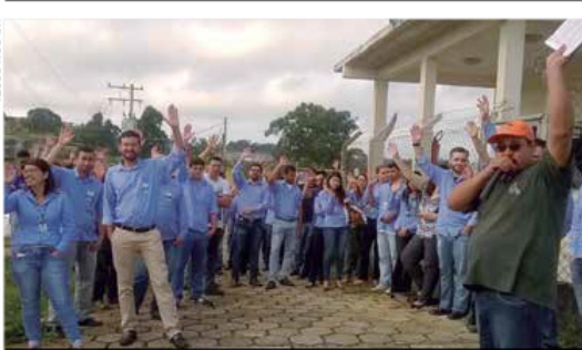
Companheiros da Protec Export aprovam proposta de PLR