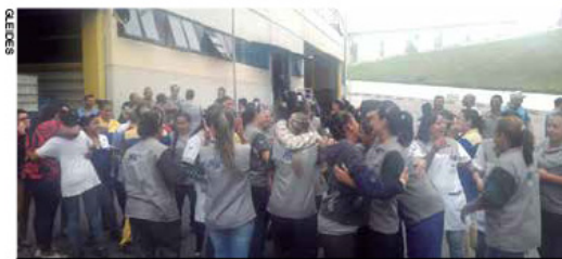
Abraço fortalecedor entre companheiras da Nyaço, Budai e Nylog