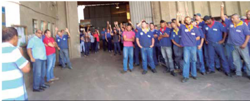
Patrão tem até dia 6 para regularizar pagamentos na MKS, senão companheiros vão para greve

O Sindicato fez o questionamento para que a empresa fosse obrigada a respeitar a organização dos trabalhadores e a legislação. Agora, a Bronzearte terá de pagar indenização por danos morais coletivos no valor de R$ 30 mil em produtos, que serão destinados a entidades escolhidas pela empresa e pelo Sindicato e fica obrigada a negociar com o Sindicato sem-