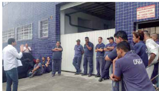
Companheiros da DM Lustres também fecham acordo de PLR