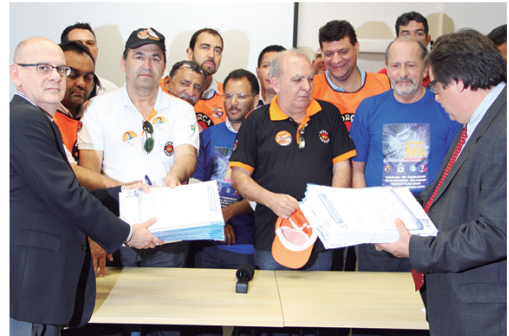
Dirigentes sindicais entregam pauta a representantes dos grupos 10 e 19-3

A partir do dia 16, vai começar o mutirão de assembleias nas metalúrgicas de Alphaville, Barueri e Cotia. No dia 20 (sábado), começa também a nova série de seminários para os companheiros dessas fábricas. Veja no quadro ao lado: