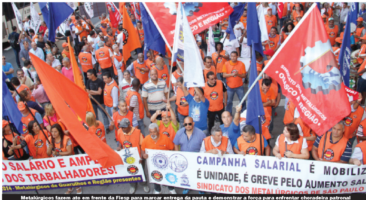
Metalúrgicos fazem ato em frente da Fiesp para marcar entrega da pauta e demonstrar a força para enfrentar choradeira patronal