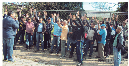
Organizados, companheiros da Minor conquistam cesta básica e uniformes