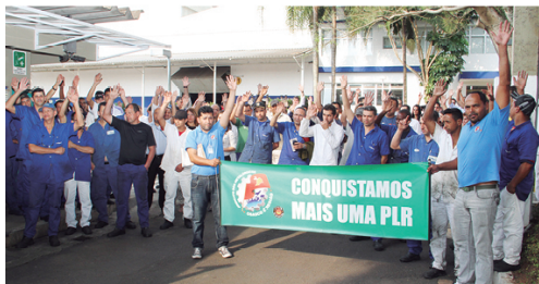
Com a força do Sindicato, trabalhadores da Spirax Sarco garantem PLR

PLR GARANTIDA – Os companheiros da Eletro Luminar, Spirax Sarco e da Vicon se uniram ao Sindicato e estão com a PLR garantida. A organização dos trabalhadores foi fundamental para a conquista.