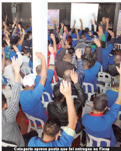
Categoria aprova pauta que foi entregue na Fiesp