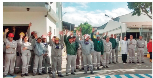
Metalúrgicos da Taboca estão em luta pela retomada do pagamento da PLR