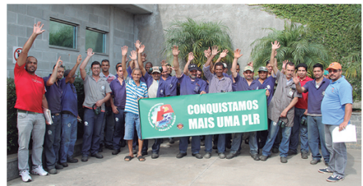
Trabalhadores da Eletro Luminar aprovaram proposta de PLR