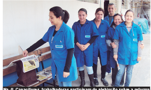
Na J.L. Capacitores, trabalhadoras participam do plebiscito sobre a reforma