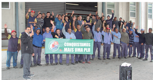
Companheiros da Vicon aprovam proposta de PLR negociada com empresa