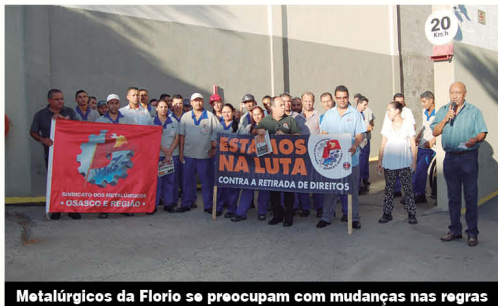
Metalúrgicos da Florio se preocupam com mudanças nas regras