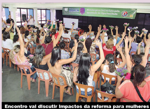
Encontro vai discutir impactos da reforma para mulheres

Em Osasco, na quarta-feira, 8, o Dia da Mulher, será marcado com luta. As mulheres do nosso Sindicato junto as de outras entidades sindicais e instituições vão somar forças num ato contra as reformas trabalhista e da Previdência. Elas também vão reivindicar o retorno da Coordena-