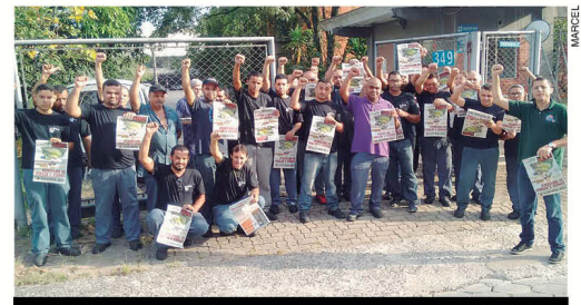
Na Minor, companheiros se revoltam com ataques a direitos