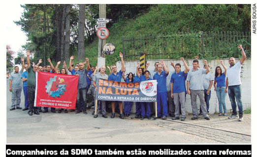
Companheiros da SDMO também estão mobilizados contra reformas

mer, chegou a veicular em rede social uma campanha que condiciona a existência de programas sociais, como Bolsa Família e Fies, à aprovação da reforma. Também, segundo algumas agências de notícias, tem ameaçado retirar cargo de parlamentares da base aliada contrários ao projeto. A previsão é que a reforma da Previdência seja votada na Câmara em abril.