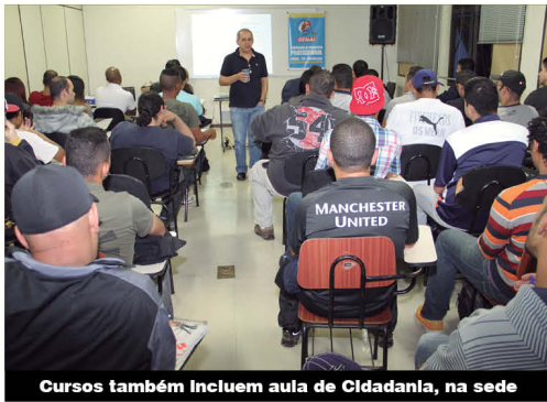
Cursos também incluem aula de Cidadania, na sede

O Sindicato fechou nova parceria com a escola Senai, de Osasco, para proporcionar aos sócios 10 cursos de qualificação profissional.