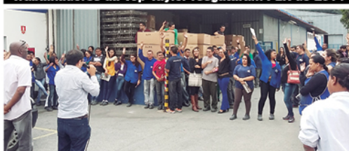
Metalúrgicos da Zoppas fecharam mais uma PLR