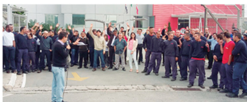
Companheiros da Danfoss estão com a PLR garantida

As empresas pertencem ao Grupo 2, Sindmaq.