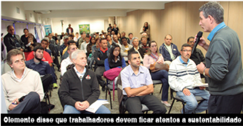
Elemento disse que trabalhadores devem ficar atentos a sustentabilidade