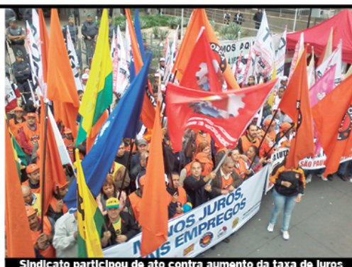
Sindicato participou de ato contra aumento da taxa de juros