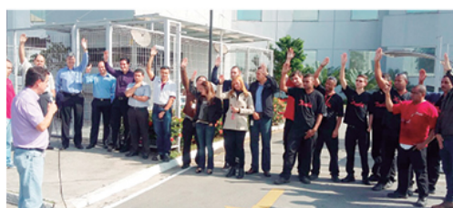
Os companheiros da Power Solutions aprovaram PLR

OSASCO – Com apoio do Sindicato, os companheiros da Top Taylor resgataram PLR de 2014 e já iniciaram as negociações para a de 2015.