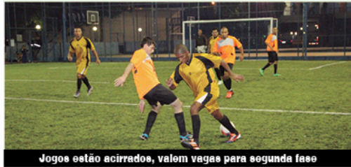
Jogos estão acirrados, valem vagas para segunda fase

Na semana passada tivemos dini (Unidos do Ouro); Fícosa 1 quatros jogos. Veja os resultados: X 5 Adelco; Bosch 2 X 2 ForjaFix; dos dos jogos: Apax 2 X 0 Coza-Cobrasma/CBFA 2 X 6 Novex.