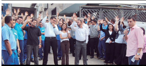
Trabalhadores da Top Taylor resgataram PLR de 2014