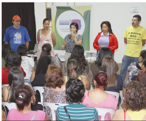
Diretoras também destacaram participação da mulher na política

As mulheres da categoria se reuniram no último sábado, 1º, para analisar a participação feminina na Campanha Salarial, no Sindicato e na política brasileira. O encontro com dezenas de companheiras aconteceu no Metalcamp. P.3